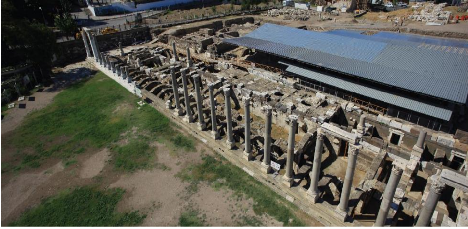
Şekil 3.3.2) Agora Surlar