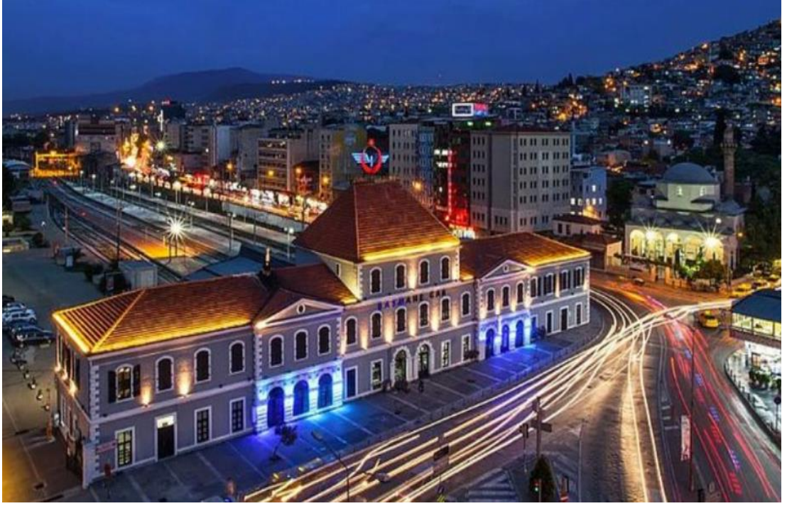
Şekil 2.3.1) Basmane Garı ve Çevresi

Basmane'nin kültürel yapısı, Osmanlı döneminin ticaret ve sosyal yaşamını yansıtan çeşitli unsurlar içerir. Bölgedeki hanlar ve kervansaraylar, İzmir'in eski ticaret yollarındaki önemini ve bu yollar üzerindeki sosyal etkileşimleri gözler önüne sermektedir..