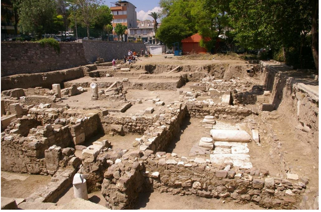
Şekil 5.1.1) Altınpark Arkeoloji Alanı

birlikte ele geçen dikkate değer miktardaki kemik ağırsaklar, alanın ya bu tip objelerin üretildiği ya da bu objelerin kullanıldığı tekstil atölyelerinin bulunduğu bir sanayi alanına dönüşmüş olabileceğini işaret etmektedir.