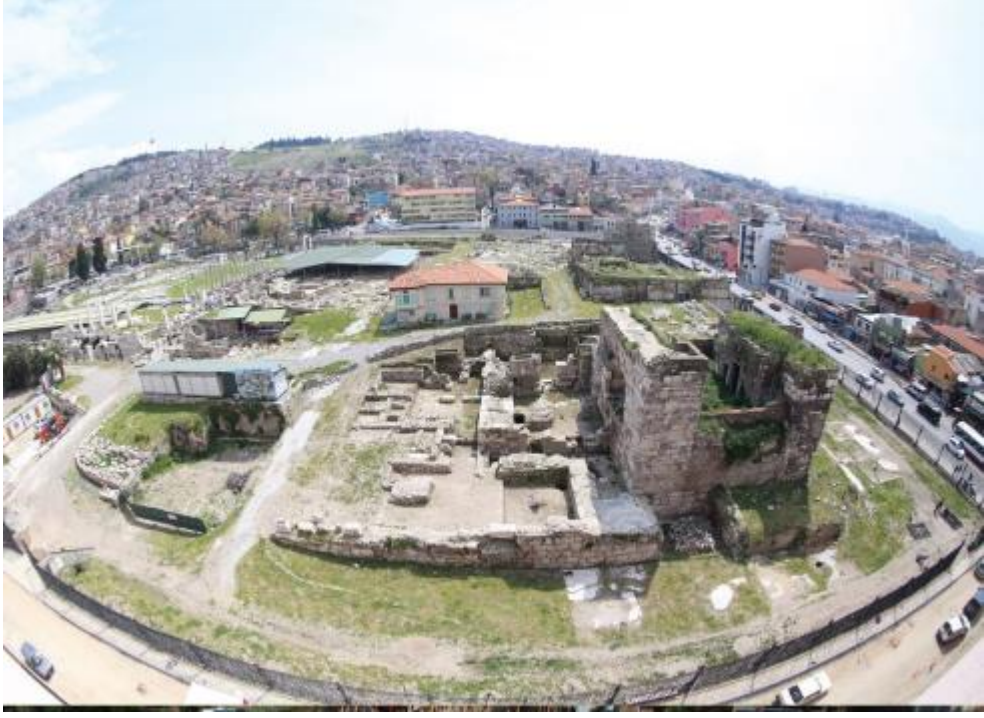
Şekil 3.3.1) Agora