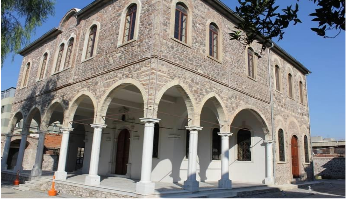
6.1.1 ) - Aya Vukalos Klisesi