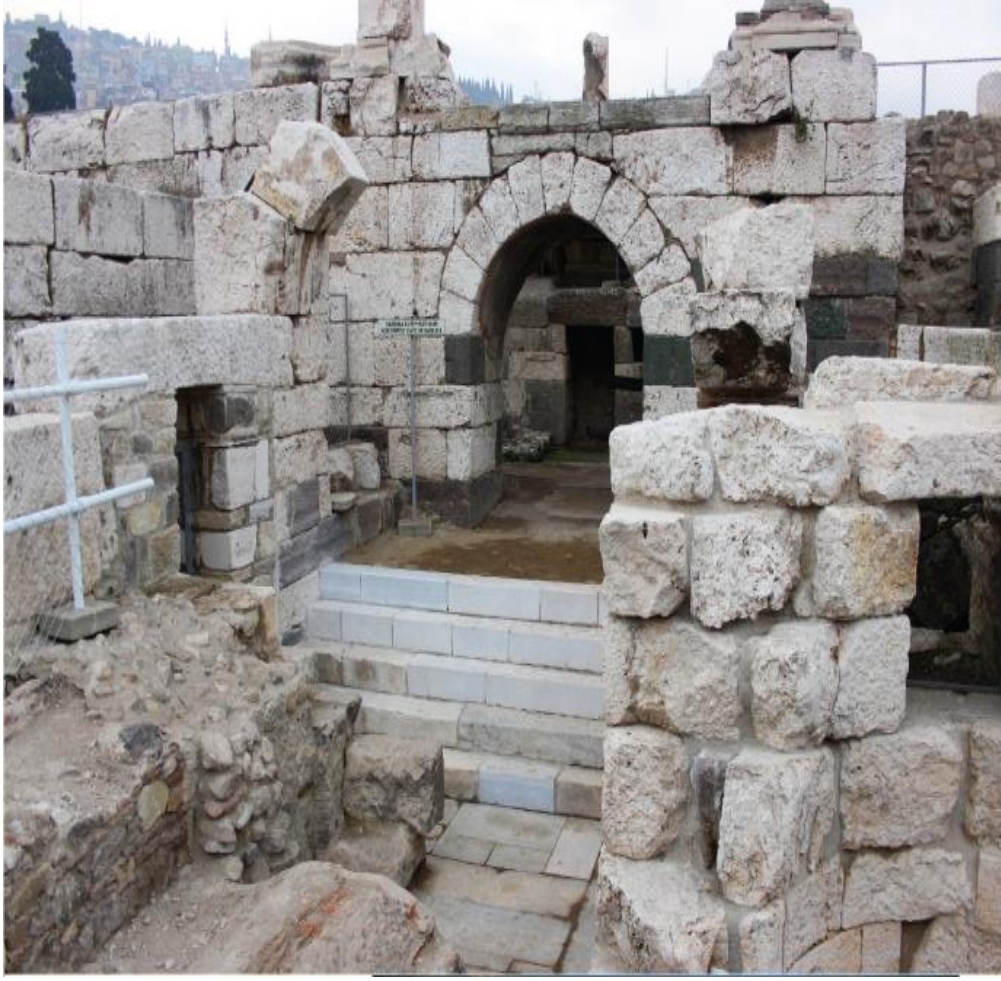
Şekil 3.3.3) Agora Surlar