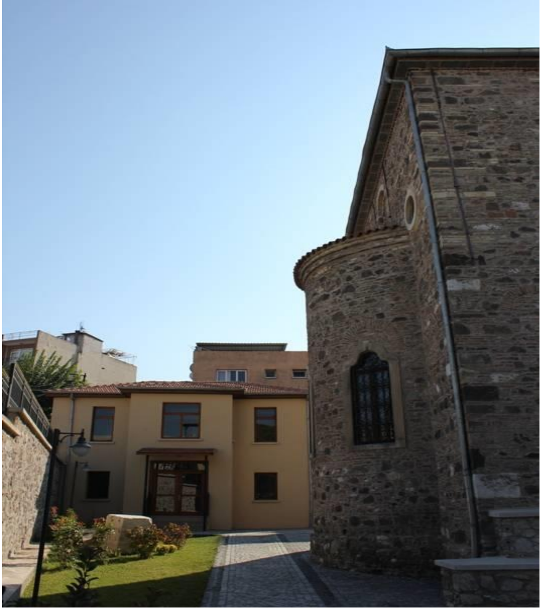
6.1.2 ) - Aya Vukalos Klisesi