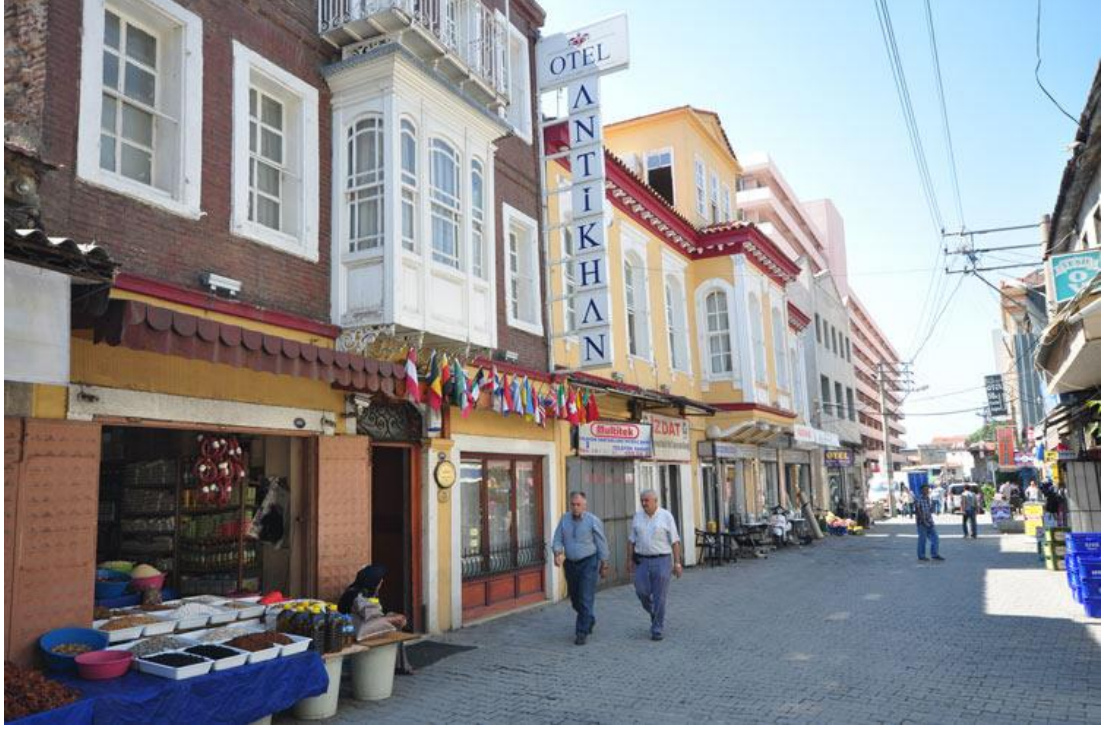
Şekil 2.3.2) Basmene Sokakları