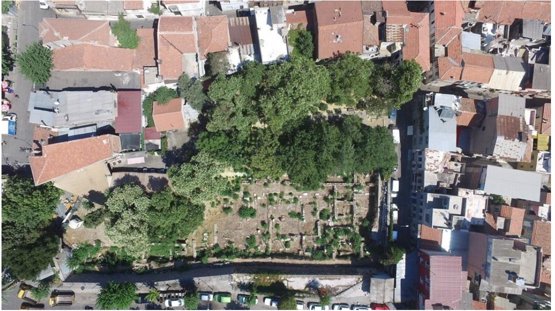
Şekil 5.1.2) Altınpark Arkeoloji Alanı