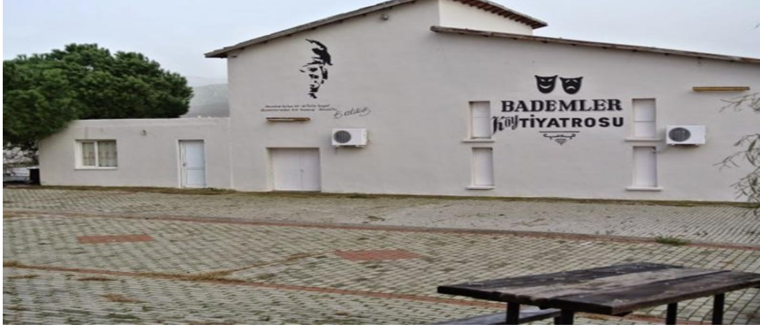
Şekil 4. Bademler Köy Tiyatrosu