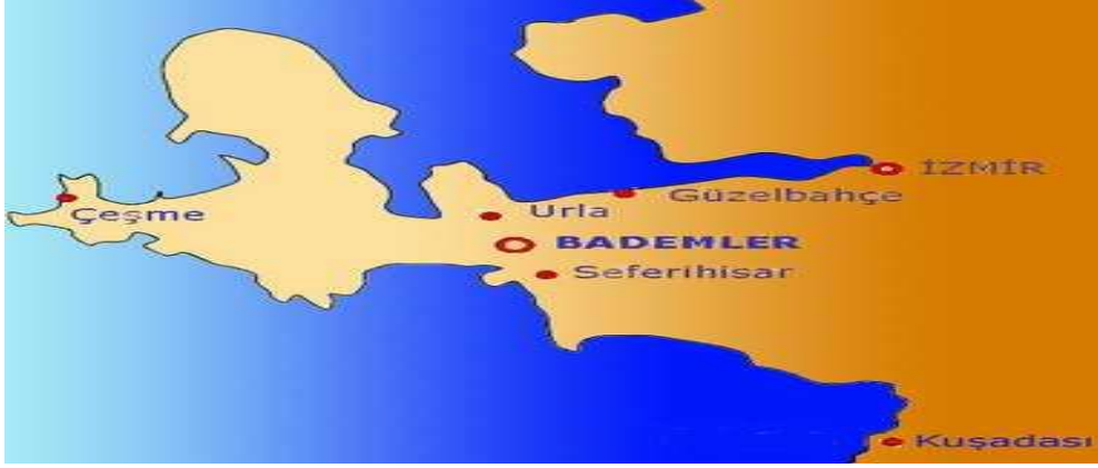
Şekil 3. Urla-Bademler Haritası