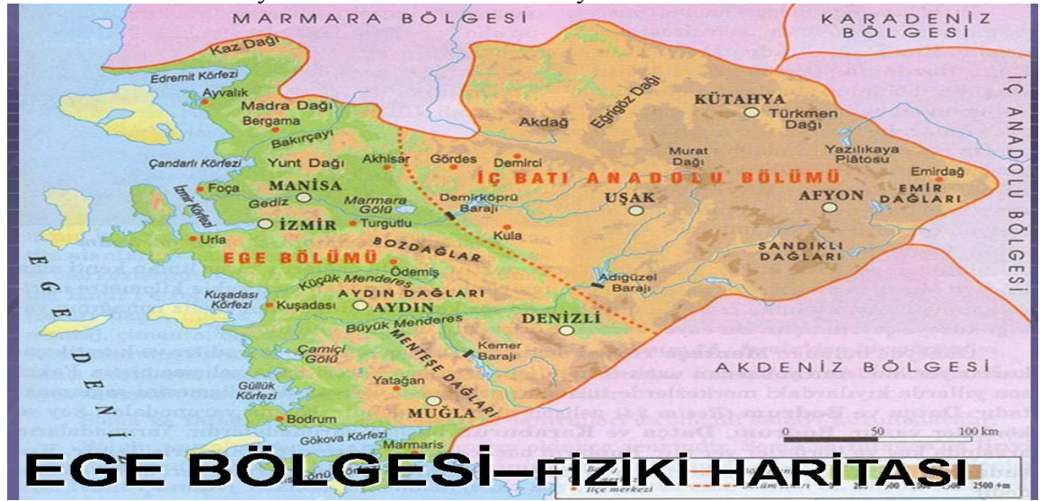
Şekil 2. Ege Bölgesi Fiziki Haritası

Urla, 38°18'K 26°45'D koordinatlarında yer almakta olup, İzmir il merkezine 35 km uzaklıkta bir ilçe. Doğusunda Güzelbahçe ve Seferihisar; batısında Çeşme; kuzeybatısında Karaburun; kuzeyinde ve güneyinde Ege Denizi ile sınırlanmıştır. Yüzölçümü 704 km 2 'dir. 16 köyü bulunmaktadır. Bademler ise Güzelbahçe'den başlayıp Seferihisar'a doğru uzanan geniş koridorun ortalarında, İzmir'e 35, Seferihisar'a ve Urla'ya 9'ar km. uzaklıkta bir köy