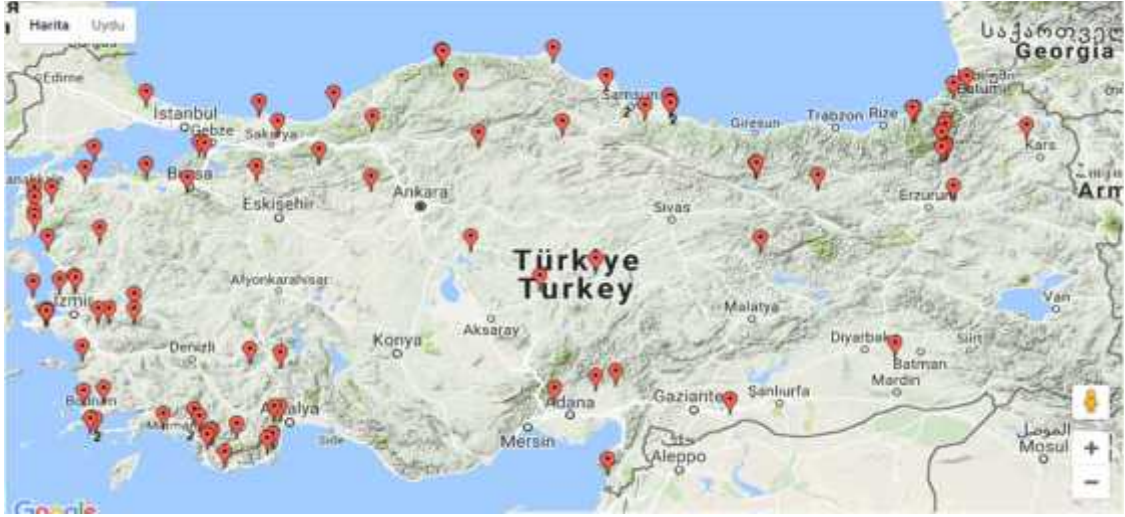
ekil 1: TaTuTa Çiftliklerinin Harita Üzerinde Gösterimi (www.TaTuTa.org)

Bölgesinde, 5 tanesi Do u Anadolu Bölgesinde, 6 tanesi ç Anadolu bölgesinde, 2 tanesi Güney Do u Anadolu Bölgesinde, 25 tanesi Karadeniz Bölgesinde ve 14 tanesi ise Marmara Bölgesinde bulunmaktadır.