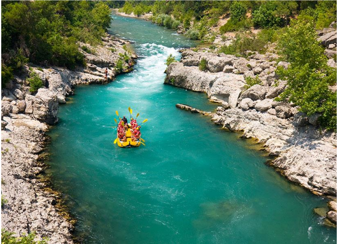
Resim 20 – akarsu turizmi

Başlıca, ülkemizde yapılan akarsu turizmi faaliyetleri, rafting, kano ve nehir kayağı, çok yaygındır. Akarsu turizmi ile ilgili gerekli altyapı çalışmalarının yapılması ve olanaklarının artırılması önemlidir. Akarsu turizminin yapıldığı bölgedeki, kıyı ve kayalıklar bu turizm ile bir bütün olarak düşünölmeli, gerekli koruma önlemleri alınmalıdır.