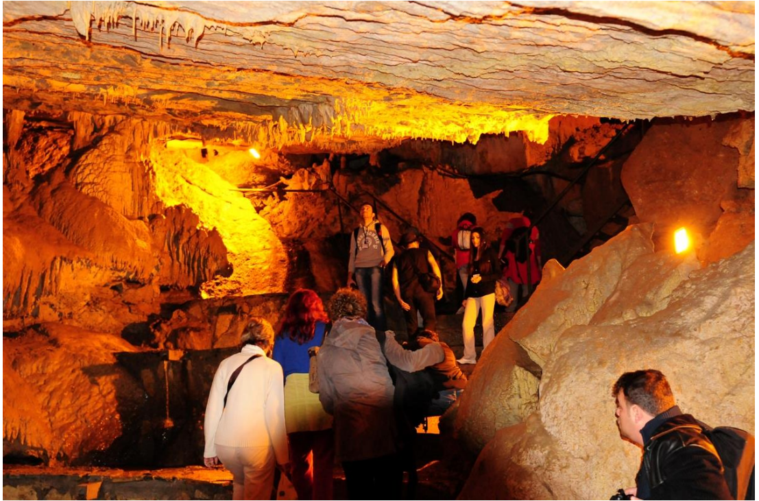
Resim 12 – Mağara turizmi

https://hague6185.wordpress.com/2013/10/20/5182/(08.04.2017)