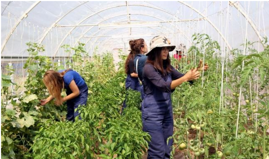
Resim 14 - Tarım ve çiftlik turizmi

http://www.turkiyeturizm.com/news_detail.php?id=11163 (08.04.2017)