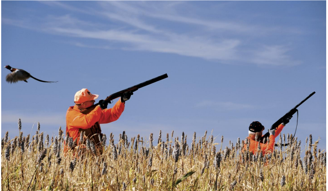
Resim 19 – Av turizmi

Av Komisyonu Merkezi Kararları doğrultusunda, avlanma ile ilgili hayvan çeşitliliğine ve kurallarına uymak, yıldan yıla farklılık arz etmektedir. Büyük av hayvanlarından ayı, kurt, domuz gibi türlerin yabancı avcılar tarafından avlanmalarında, çeşitli düzenlemeler getirilmiştir. Belli başlı avlaklarda yapılan, avlanma faaliyetleri dışına çıkılamaz, bu ekoturizm çeşidinde hayvanların üreme ve yavrulama dönemleri ve sayısal verileri önemli kriterlerden dir.