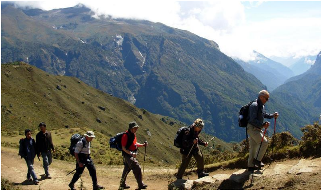
Resim 10 – Doğa yürüyüşü

http://kalkanorganization.com/trekking-doga-yuruyusu/(08.04.2017)