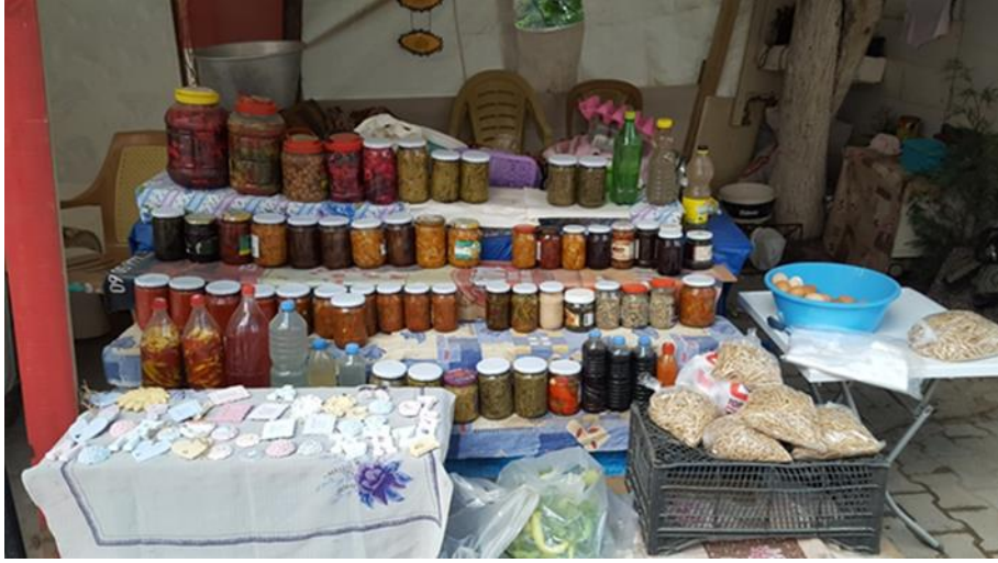
Resim 50 - Yerel pazar tezgâhındaki el emeđi ürünler