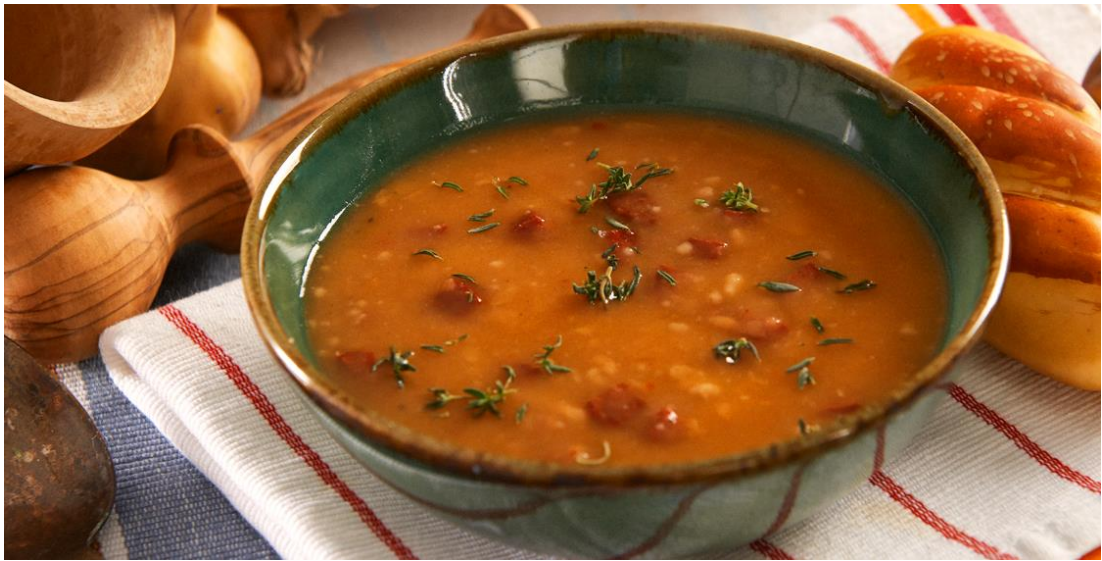
Resim 42 – Tarhana Çorbası

Tarhana çorbası geleneksel Türk tatları arasında yer almaktadır. Her öğün tüketilebilen tarhana çorbasının ana maddesi kese yoğurdu, domates, un, tuz, soğan gibi malzemelerden oluşmaktadır. Bu malzemeler karıştırılıp pişirildikten sonra güneşte kurutulup, yıl boyunca tüketilebilmektedir. Buca Kaynaklar bölgesinde de her çeşidi yapılan tarhana çorbası bölge için farklı bir tattır.