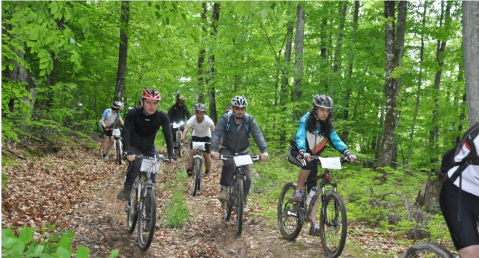
Resim 25 – Bisiklet turizmi

Motorsuz ulaşım araçlarından biri olan bisiklet, performans geliştirmenin yanı sıra doğayı keşfetmenin verdiği zevkle bütünleşir. Ülkemizin pek çok yöresi, bisiklet turları yapmaya elverişli olup, Karadeniz, Bandırma, Polenezköy, Erciyes ve Kapadokya, Ihlara ve tuz gölünde turizm bakanlığı tarafından belirlenen rotalarda, bisiklet turizmi çalışmaları yürütülmektedir.