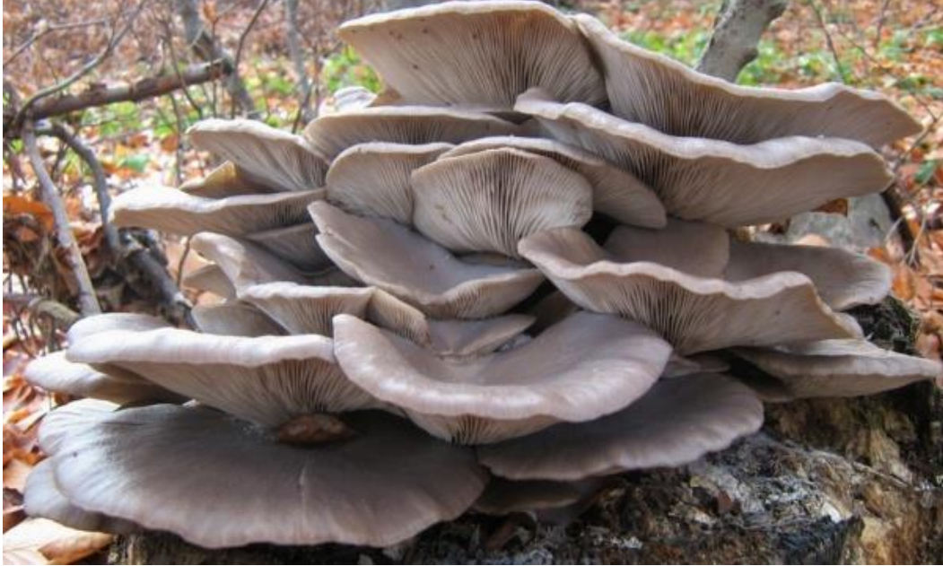
Resim 44 – İstiridye Mantarı

poşetlerde karanlık ve nemli ortamlarda sabit bir ısı düzeyinde yetiştirilen istiridye mantarlarında organik toprak kullanılmaktadır. Bir ilaç özelliği taşıyan çok besleyici ve faydalı olan istiridye mantarı, diğer mantar türlerine göre de önemli farkları vardır. Bazı kanser türlerinde genelde ilaç olarak kullanılmaktadır.