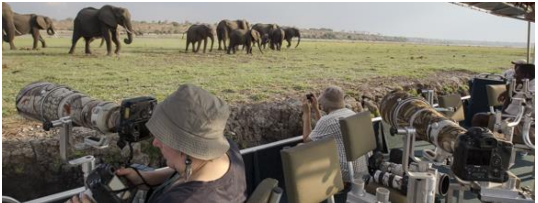
Resim 5 – foto safari gözlemciliği

İnsanların hem gezmek, hem de gezerken gördükleri doğal güzellikleri fotoğraflama sanatına foto safari denir. Ülkemiz zengin foto safari kaynaklarına sahiptir, macera ve keşfetme amacıyla olan ekoturistler için birçok seçenek bulunmaktadır.