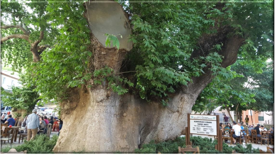
Resim 27 - Kunduracı Çınarı (Anıt Ağaç)

Kaynaklar'ın simgesi, Tarihi Çınar Ağacıdır. Yörenin en belirgin simgesi haline gelmiş olan, Buca Kaynakların 'Kunduracı Çınar Ağacı' Tabiat Varlıkları Koruma Kurulunun, 1994 yılındaki teknik incelemesinde, 1025 yaşında olduğu ve 30 metre boyunda, 15 metre çapıyla tespit edilmiş 29.09.1994 yılında, anıt ağaç, olarak tescil altına alınmıştır.