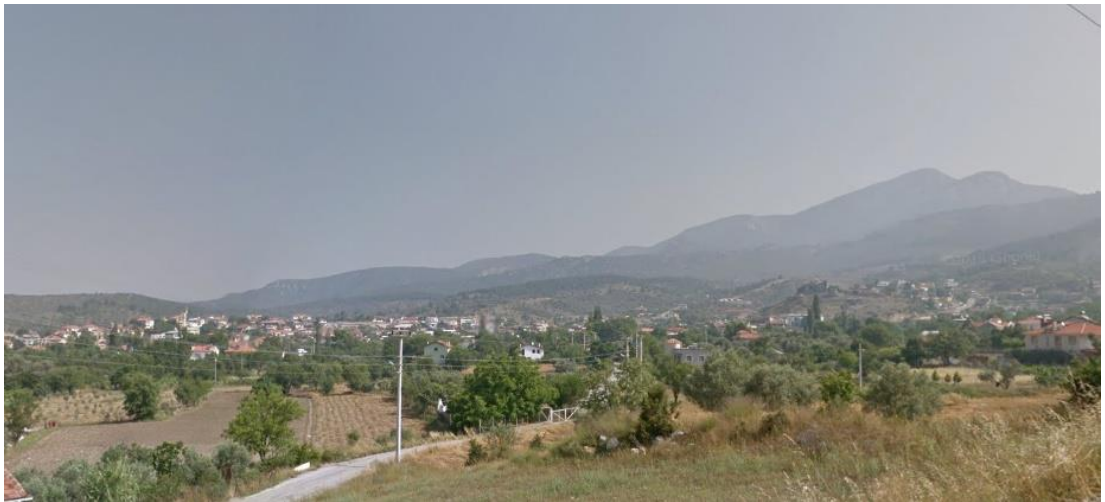
Resim 30 - Buca Kaynaklardan görünüm