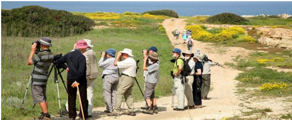
Resim 2 – Kuş Gözlemciliği (Ornitoloji)

http://www.kidstoppress.com/2015/02/bird-watching-in-mumbai-a-hangout-in-the-wild/ (02.04.2017)