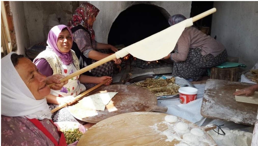
Resim 46 – Gözleme

Gözleme, ince olarak açılmış yufkanın çeşitli içlerle doldurulduktan sonra, sac üzerinde odun ateşinde pişirilmesi şeklinde hazırlanan, bir çeşit aperatif Türk böreğidir. Gözlemeye iç olarak haşlanmış patates, çökelek, istiridye mantarı, kıyma katılmaktadır.