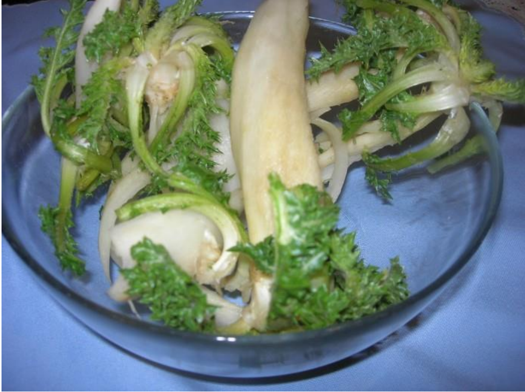
Resim 43 – Şevketi Bostan

Doğada, gelişi güzel yetişen şevketi bostan çok faydalı otlar arasında yerini almıştır. Ege mutfağında önemli bir yeri olan şevket-i bostan, Buca Kaynaklarda da önemli bir yerel tattır. Kasım ayında olgunlaşan şevket-i bostan bahara kadar taze olarak tüketilmektedir. Esnaf pazarlarında ve yerel pazarlarda çokça yerini alan şevketi bostanın çok çeşitli yemekleri yapılmaktadır. Şevketi bostanın dalları, yaprakları ve kökü ile yapılan çok çeşitli yemekleri vardır. Genellikle etli ve zeytinyağlı yemekleri yaygındır.