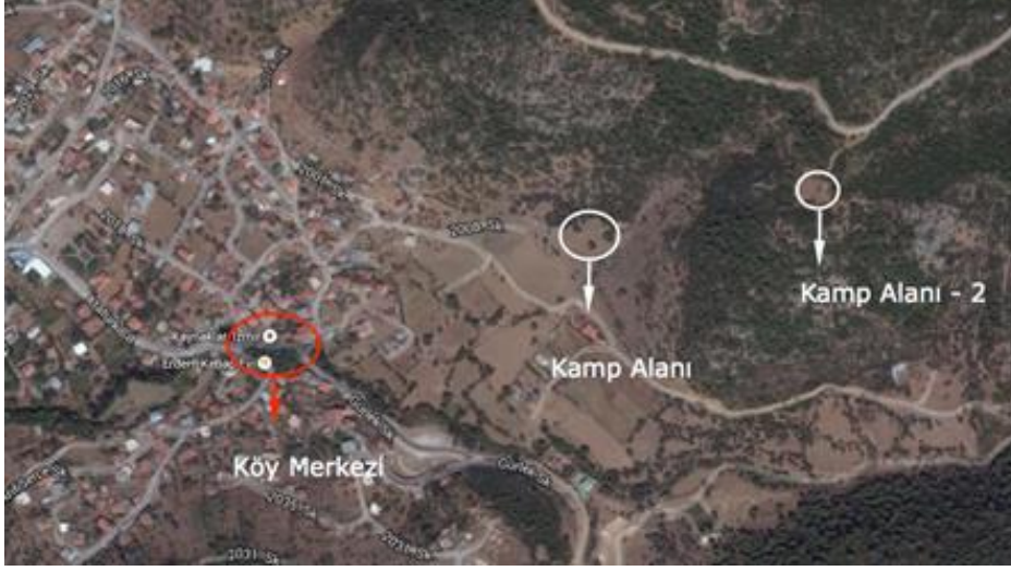
Resim 38 - Buca kaynaklar kamp alanları http://kampalanlari.net/kaynaklar-kamp-alani/(15.04.2017)

Tatil veya eğlence amaçlı, doğada geçirilecek günler için çadır ve baraka kurularak yapılan, konaklama alanına kamp alanı denir. Kamp hayatına, tabiatın vahşi kucağında yalnızlık arayan gençler ve açık arazide tecrübelerini paylaşan aile ve organize olmuş gruplar ilgi gösterirler.