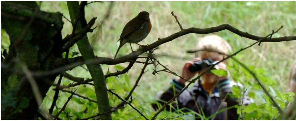
Resim 1 – Kuş Gözlemciliği (Ornitoloji)

Dünyada ve Türkiye’de kuş gözlemciliği konusunda çok hızlı gelişmeler yaşanmaktadır. Ülkemiz önemli bir kuş gözlem merkezidir. Bunun en önemli sebebi sazlık ve sulak alanlara sahip olunmasıdır. Aynı zamanda kuşların mevsimlik göç yolları üzerinde olan ülkemiz kuş çeşitliliği konusunda çok zengindir. Tüm Avrupa’daki kuş çeşitliliğinin tamamı kadar, ülkemiz kuş çeşitliliğine sahiptir. Bu konuda yapılacak olan reklam ve tanıtımlarla kuş gözlemcisi, yabancı ekoturistleri de ülkemize çekebiliriz.