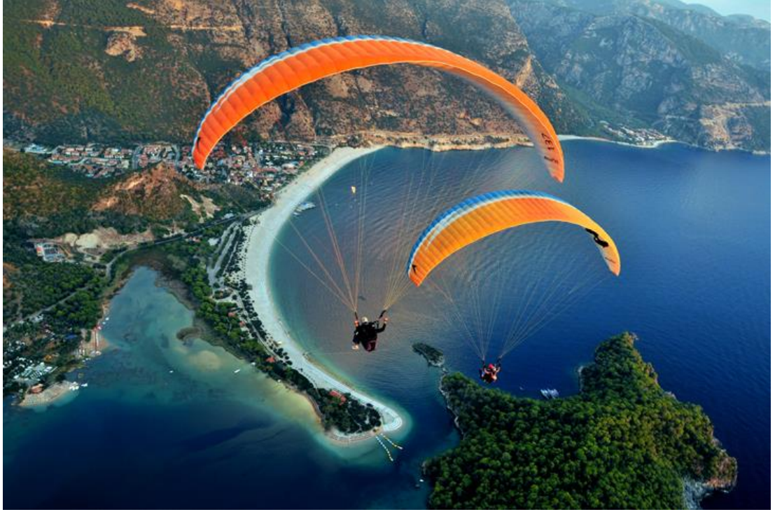
Resim 8 – Yamaç paraşütü