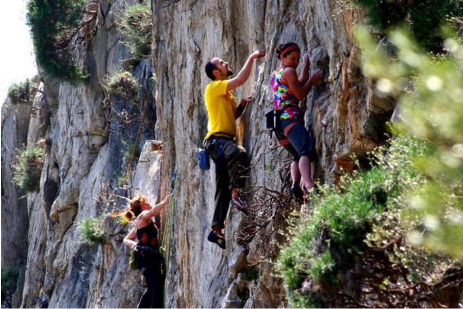
Resim 39 - Buca kaynaklar kaya tırmanış kale mevki https://www.buca.bel.tr/(15.04.2017)

Doğada bulunan, bir kaya yüzeye veya yapay bir tırmanış duvarına malzemeli, malzemesiz çıkma, inme ya da yan geçiş yapma sporuna kaya tırmanışı denir. Kaya tırmanışında amaç belli bir rotayı izleyerek ve hiç düşmeden, ipe oturmada, bitiş noktasına varmaktır. Bu spor, tırmanışçıları, fiziksel ve zihinsel olarak test eder, güçte devamlılık, teknik, denge, malzeme bilgisi, zihinsel kontrol ve problem çözme yetisi gerektirir. Önceleri dağcılığın bir kolu olan kaya tırmanışı, bugün kendi başına bir disiplin olarak kabul edilmektedir. Ülkemizde ve dünyada yapay duvarlarda yarışmaları düzenlenmektedir. Buca kaynaklar kaya tırmanışı etkinlikleri kale mevkiinde yapılmaktadır. Nisan ayı sonunda başlar, 1 hafta sürer