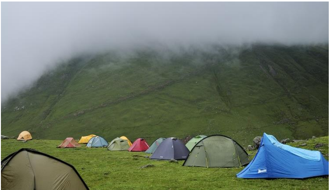
Resim 16 – Kamp karavan turizmi

http://www.turizmglobal.com/tag/kamp-ve-karavan-turizmi/ (05.04.2017)