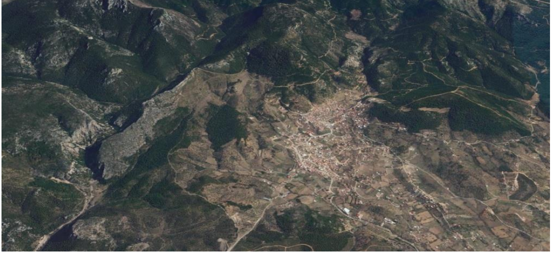
Resim 31 – Kaynaklar 3 boyutlu uydu görünümü (Google earthmaps 2017)