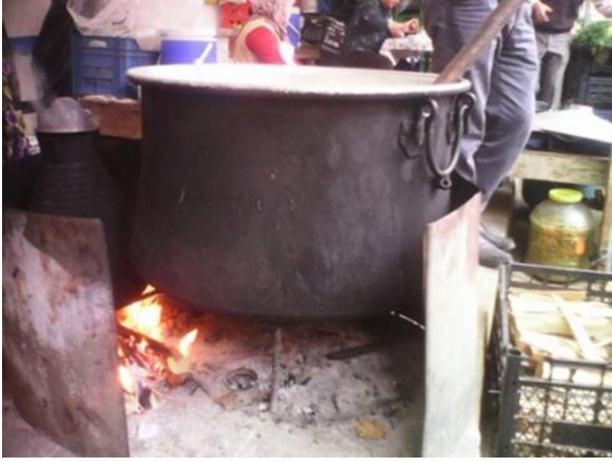
Resim 40 - Yerel tatlar (keşkek)