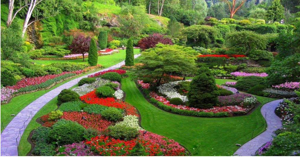
Resim 17 – Botanik turizmi

Ülkemizdeki bitki zenginliğinin en önemli nedeni 3 farklı bitki alanının birleşme alanında bulunmasıdır. Alınacak olan önlemlerle, özellikle endemik türlerin korunma altına alınması ve kaçakçılık ile ilgili önlemlerin alınması çok önem arz etmektedir.