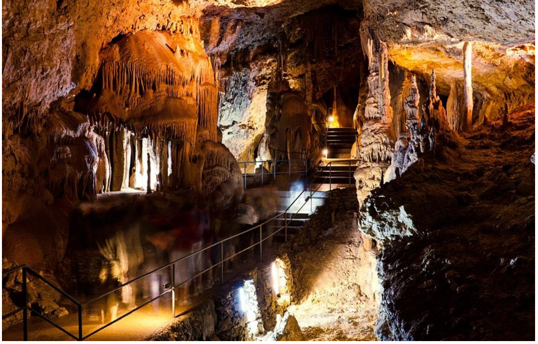
Resim 11 – Mağara turizmi

https://hague6185.wordpress.com/2013/10/20/5182/(08.04.2017)