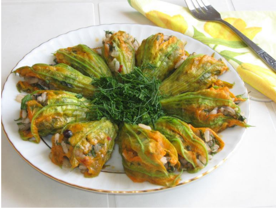
Resim 45 - Kabak Çiçeği Dolması

https://ofpof.com/yemek/ege-bolgesinin-en-meshur-15-yemegi(17.04.2017)