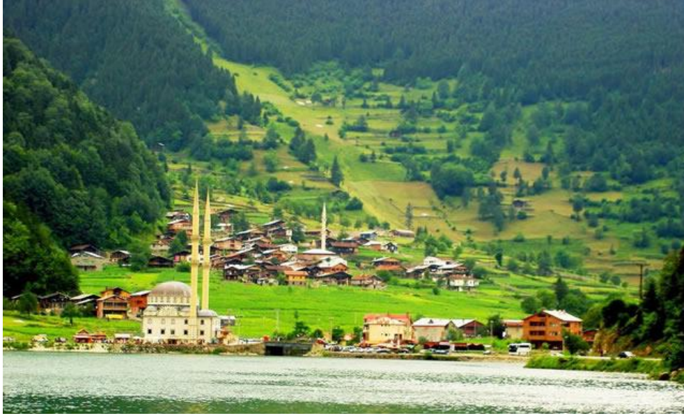
Resim 3 – Trabzon Uzungöl Yaylası