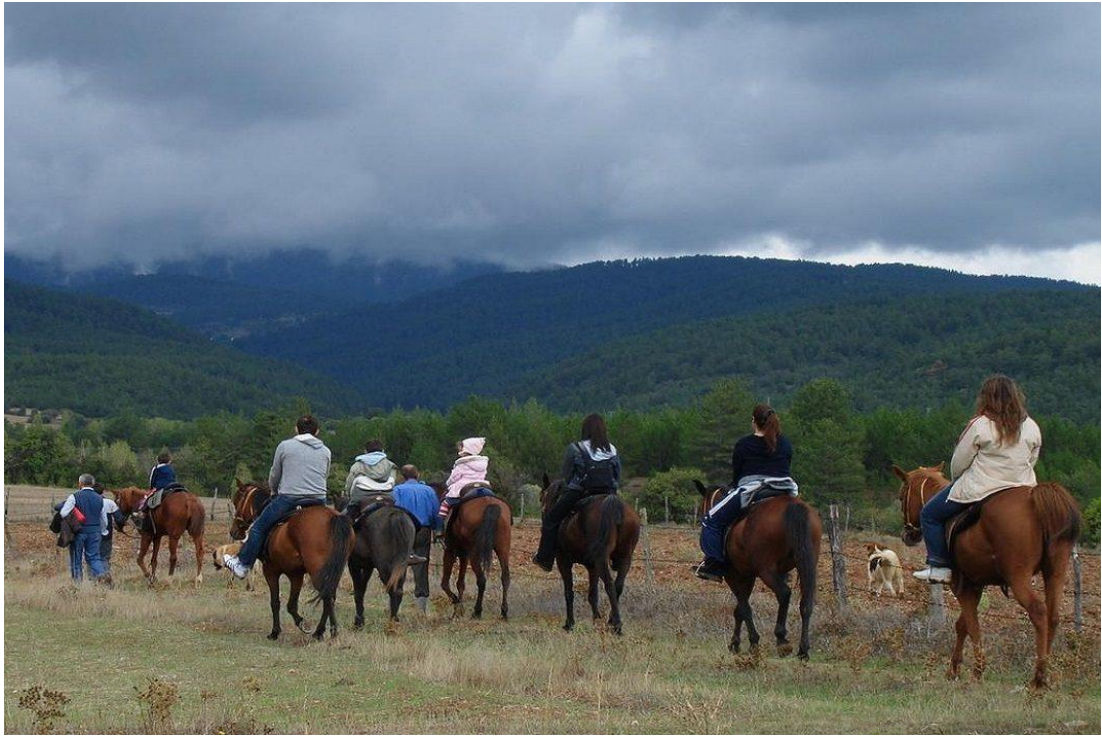
Resim 6 – Atlı doğa yürüyüşü

Atlı doğa yürüyüşü ile ekoturistler, önemli doğal güzellikler arasında seyahat ederken, ayrı bir ekoturistik heyecan yaşayabilmektedirler.