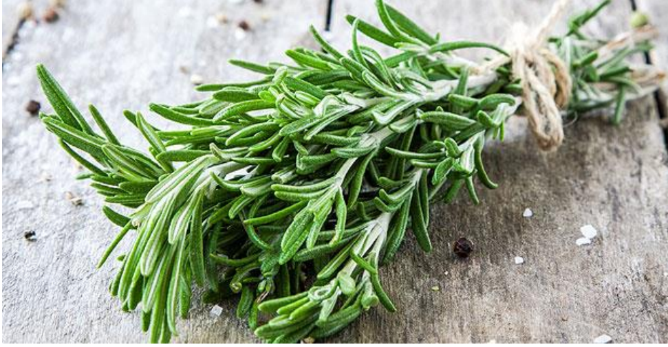
Resim 48 – kekik

dolar. Kaynayan kazandaki damıtma işlemi ortalama 1 saat sürer bu sayede kekik suyu elde edilir.