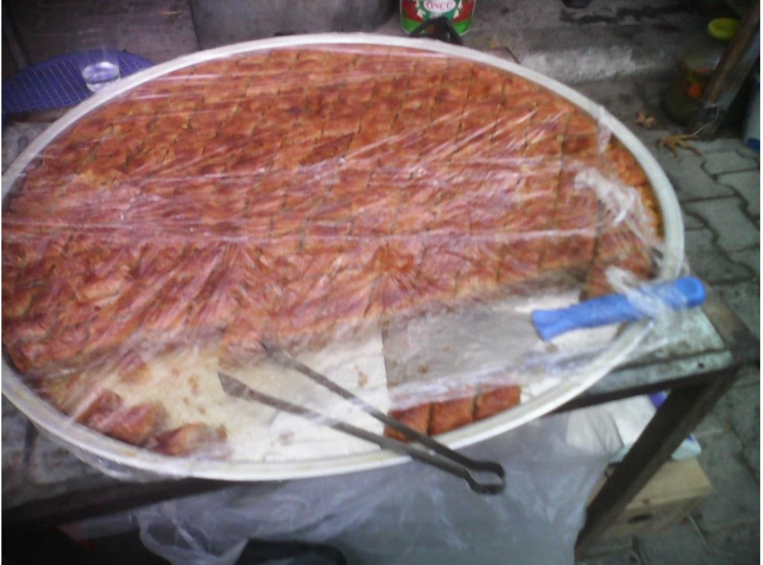
Resim 47 – ev baklavası

Baklava çok ince açılmış ve kat kat üst üste konulmuş yufkanın arasına ceviz, antepfıstığı, kaymak gibi şeyler konularak yapılan, eşkenar dörtgen biçiminde dilimlenen ve odun ateşindeki fırınlarda pişirildikten sonra üzerine şeker şerbeti dökülen bir hamur tatlısıdır. Yöre halkı evlerinde hazırladıkları, ev baklavasını yerel pazarda ekoturistlere pazarlamaktadırlar.