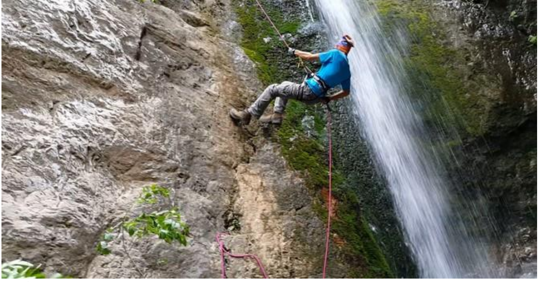
Resim 7 – Dağcılık ve tırmanma

http://www.hakkarihabetv.com/hakkaride-ilk-kaya-tirmanisi-yapildi-22147h.htm (08.04.2017)