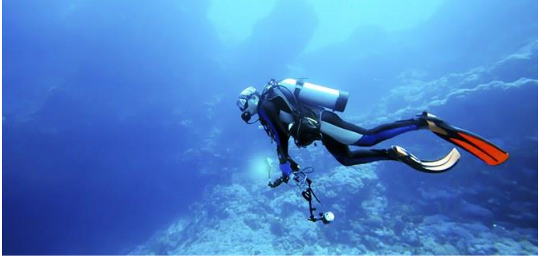
Resim 21 – Sualtı dalış

(scuba) ve serbest (tüpsüz) olarak ikiye ayrılır. 14 yaşını doldurmuş sağlıklı herkes tarafından öğrenilen dalış, Ekoturistler için önemli bir aktivitedir.