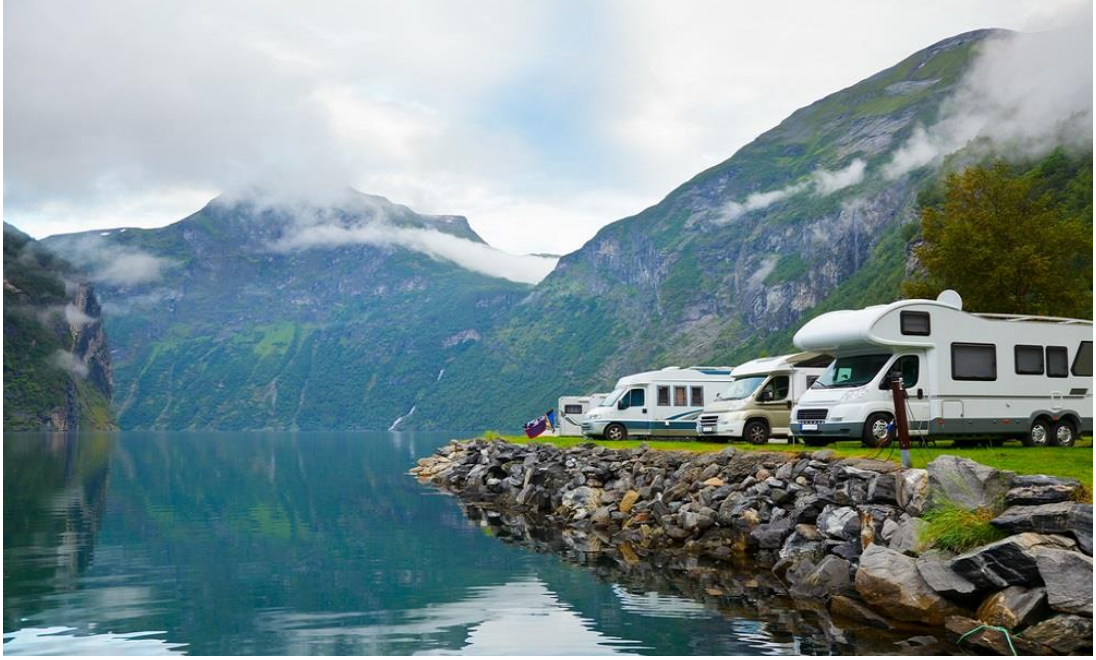
Resim 15 – Kamp karavan turizmi

Kamp ve karavan turizmi, genellikle gezici ekoturistlerin tercih ettikleri, karavan denilen, hem yolculuk yapılabilen, aynı zamanda da barınma amaçlı kullanılan, araçlar sayesinde yapılan ekoturizm türüdür. Ziyaret edilen ekoturistik alanda konaklayan, karavan kullanıcıları ayrı bir ekoturistik faaliyet sergilemektedirler.