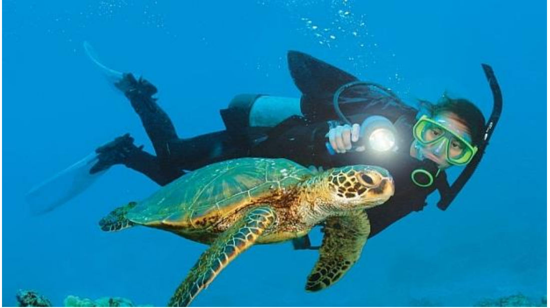
Resim 22 – Sualtı dalış

http://www.yaz-tatili.com/antalya-sualti-dalis/(12.04.2017)