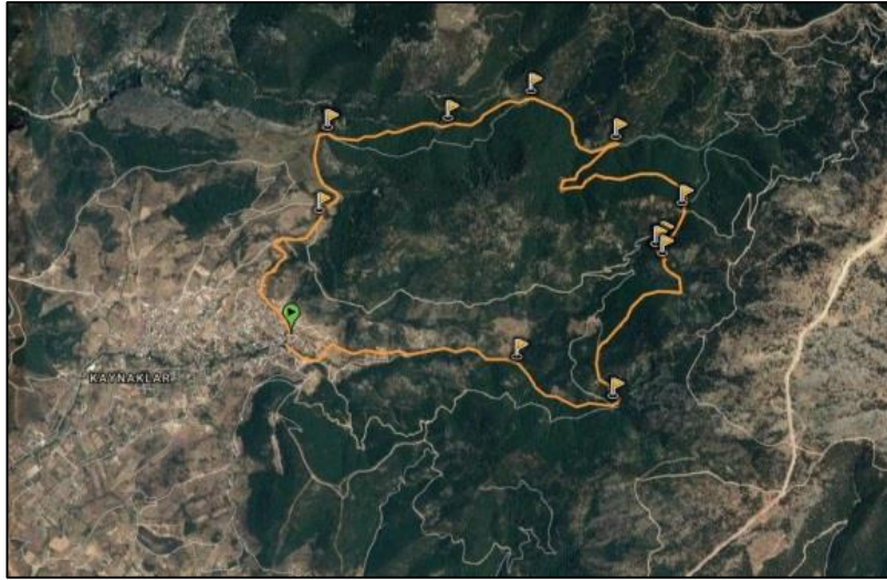
Resim 35 - Buca kaynaklar rotası

https://tr.wikiloc.com/rotalari/gezi-yuruyus/turkey/izmir(15.04.2017)