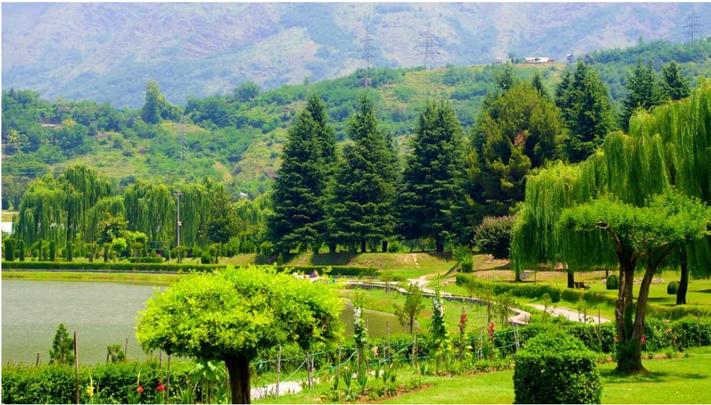
Resim 18 – Botanik turizmi

https://bilgibotanik.com/duyuru_12/(08.04.2017)