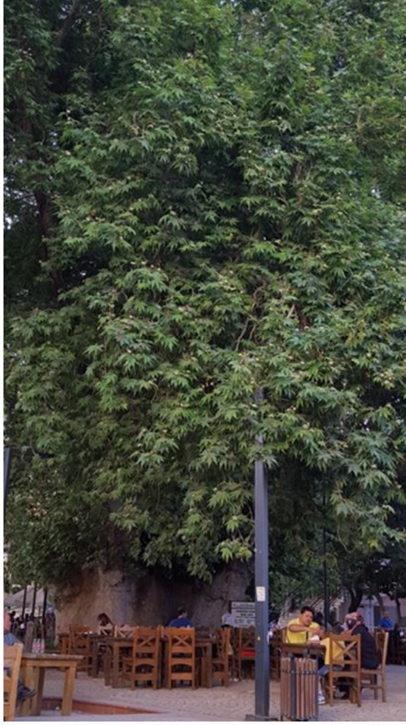
Resim 33 – Kaynaklar Kunduracı Çınarı

Buca Kaynaklar anıt ağaç bakımından çok zengin bir yapıya sahiptir. Kaynaklar merkezde 7 adet anıt ağaç bulunmaktadır. Bunların en önemlisi ve bilineni 1000 yaşını geçmiş olan ‘Kunduracı Çınar’ıdır.