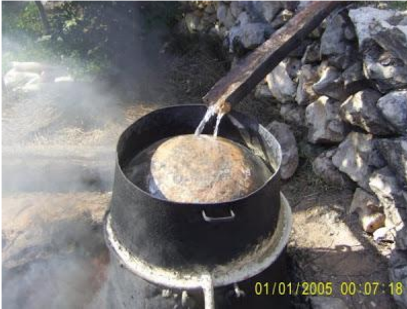
Resim 49 – kekik suyu damıtılması

http://www.hastane.com.tr/saglik/kekik-.html (17.04.2017)