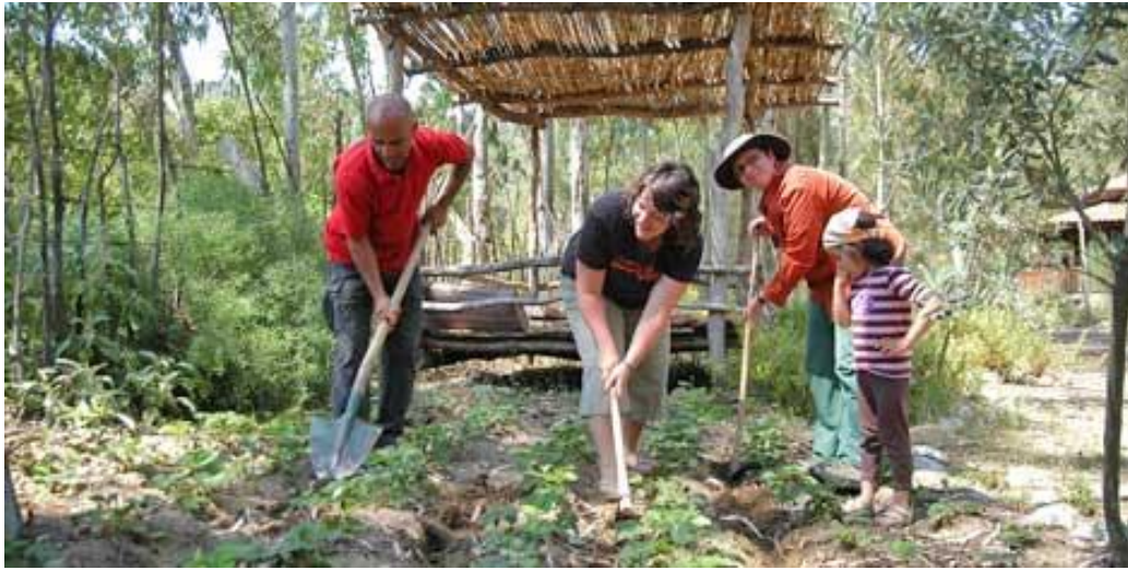
Resim 13 - Tarım ve çiftlik turizmi

Yapılan ekoturistik faaliyetlerde, katılım ve üretim alanı tarla ise tarım turizmi, ya da köy ortamında çiftlikte yapılan etkinlik ise çiftlik turizmi olarak adlandırılmaktadır.