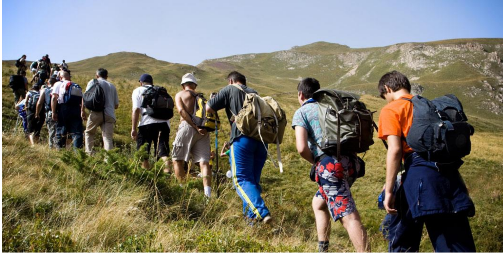
Resim 9 – Doğa yürüyüşü