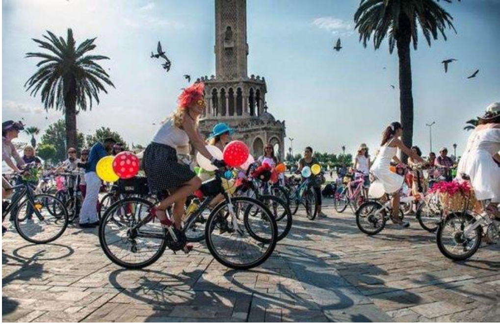
Resim 26 – Bisiklet turizmi

http://bisikletzamani.com/2016/08/20/turk-turizmine-ilac-bisiklet-turizmi/ (12.04.2017)