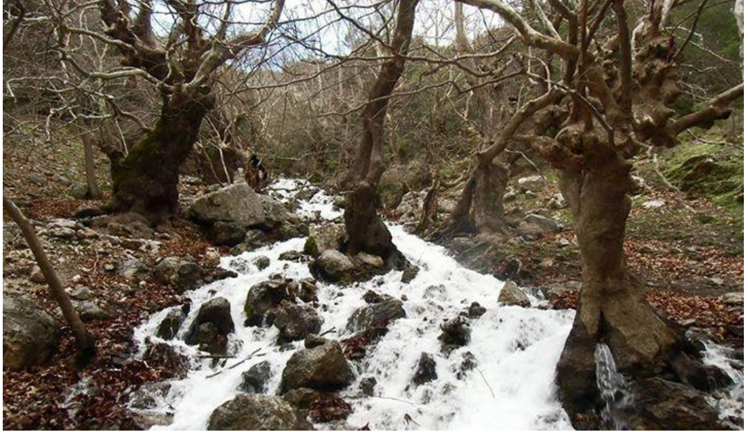
Resim 32