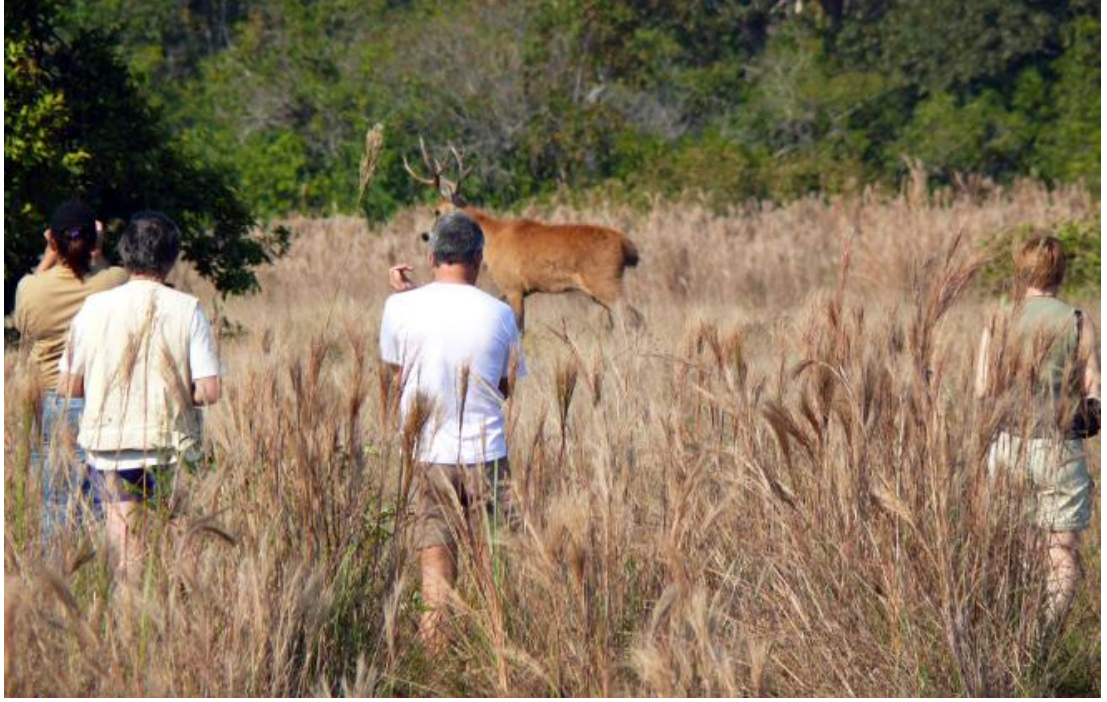
Resim 4 – Yaban hayatı gözlemciliği

http://scte-brazil.com/brazil-travel/pantanal/pantanal-wildlife-photography (12.04.2017)