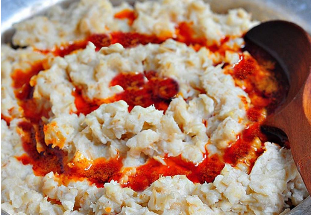
Resim 41 – Keşkek (anonim)