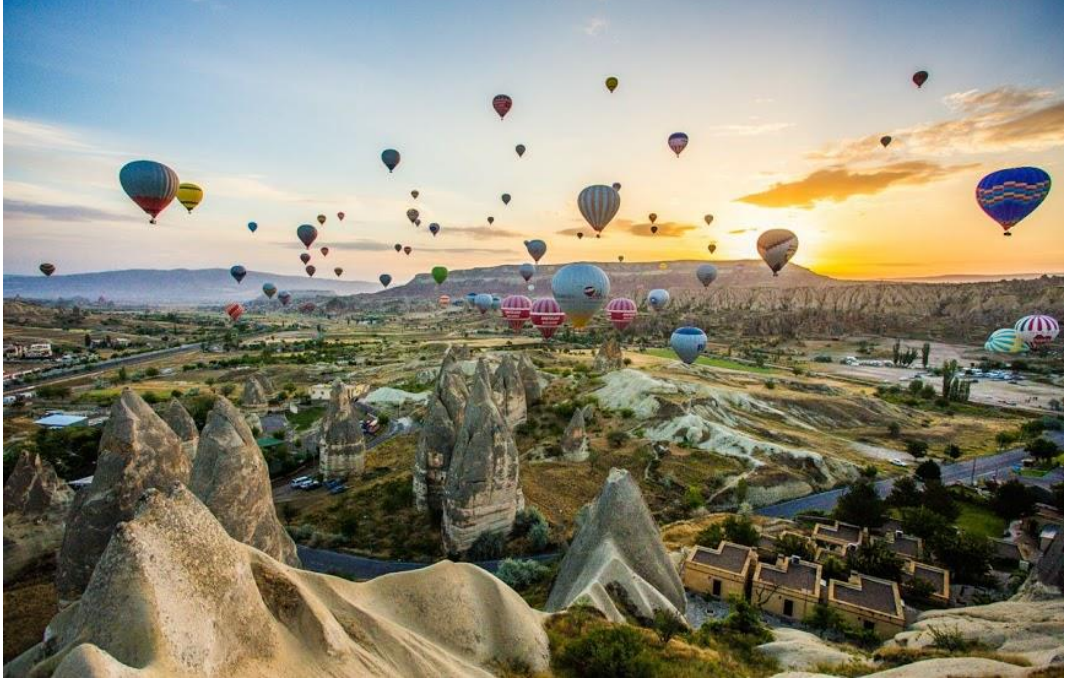
Resim 23 – Kapadokya’da balon turizmi

olarak, doęa gezginlerinin ilgi odaęı olan grsel bir deneyim trdr. Kapadokya blgesinde sadece sabah saatlerinde, gneşin doęduęu ve rzgrın en hafif olduęu durumlarda yapılabilen balon uçuşları, birok yabancı ekoturisti, sırf bu muhteşem grnty izleyebilmek iin blgeye ekmektedir.