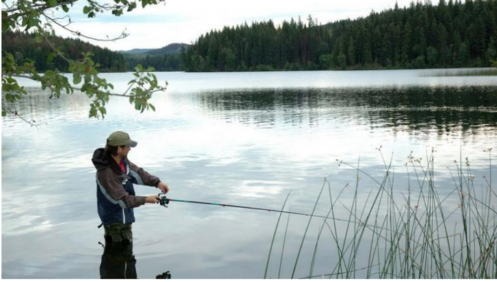
Resim 24 - Sportif olta balıkçılığı

http://www.gulses.com/haber-4-ilcede-balik-avi-yasak-36979.html (02.04.2017)