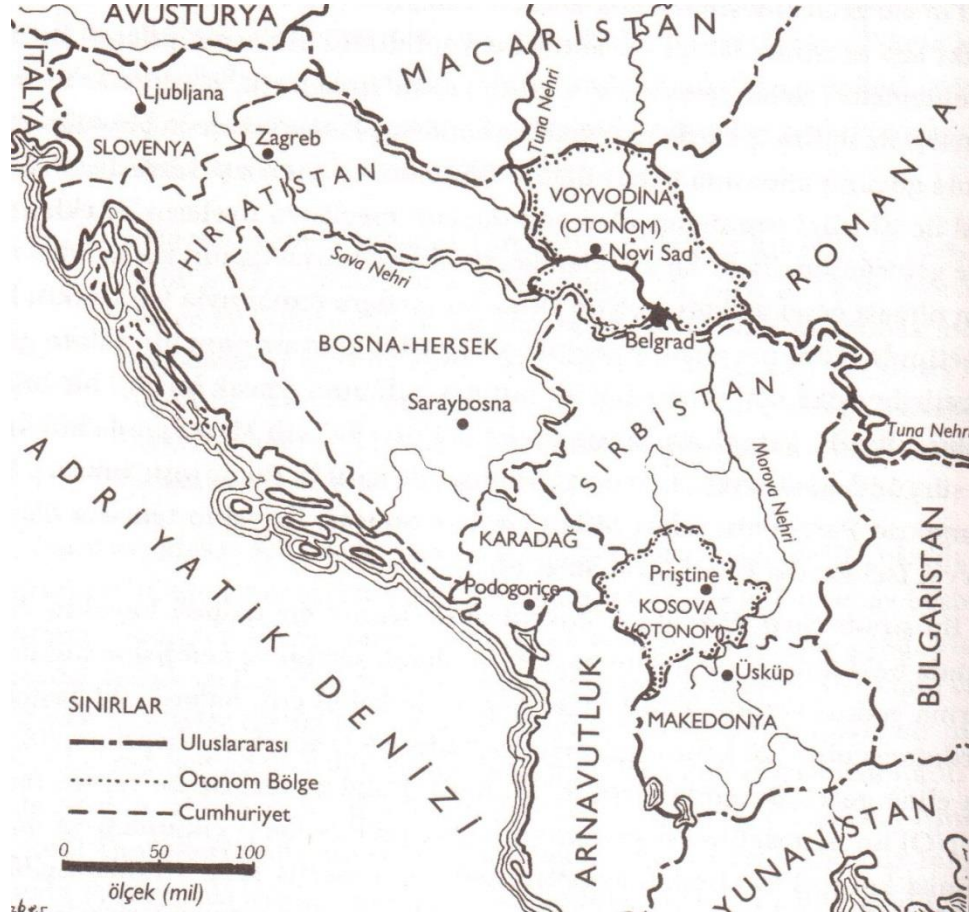
Şekil: 2.8. Savaş Sonrası Yugoslavya’da Oluşan Federal Yapı