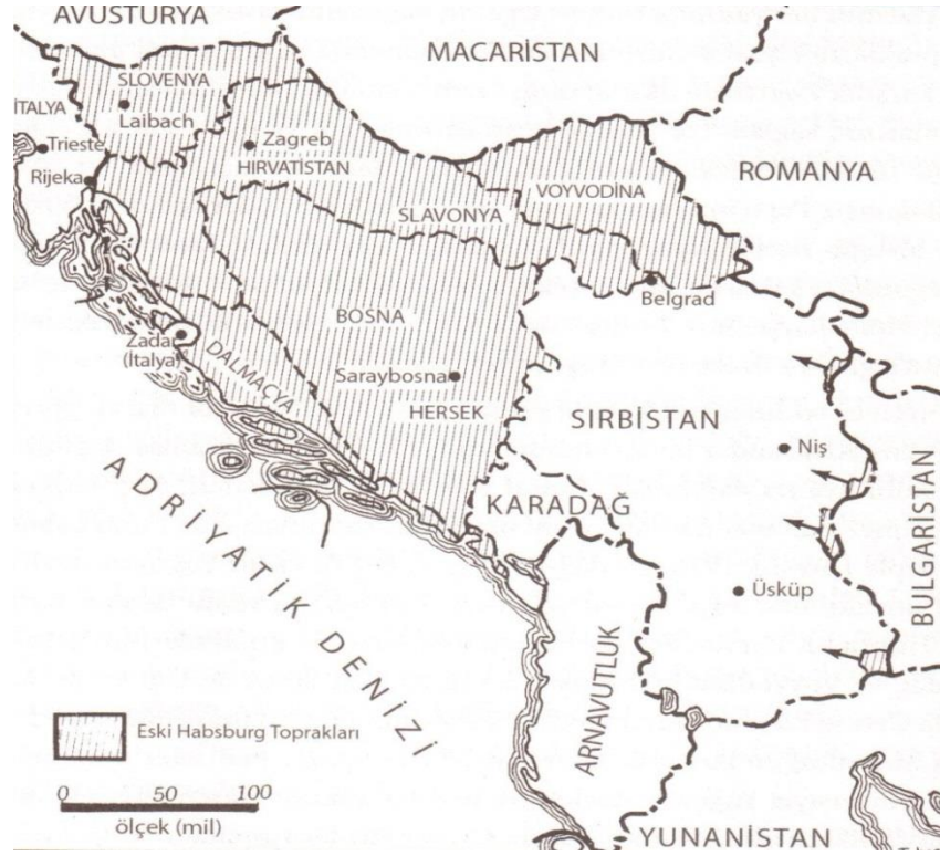
Şekil: 2.6. Sırp, Hırvat ve Sloven Krallığı'nın Oluşumu

Kaynak: Jelavich, Barbara, Balkan Tarihi 2 , (Çev. Hatice Uğur, Zehra Savan), İstanbul: Küre Yayınları, 2009, s. 158.