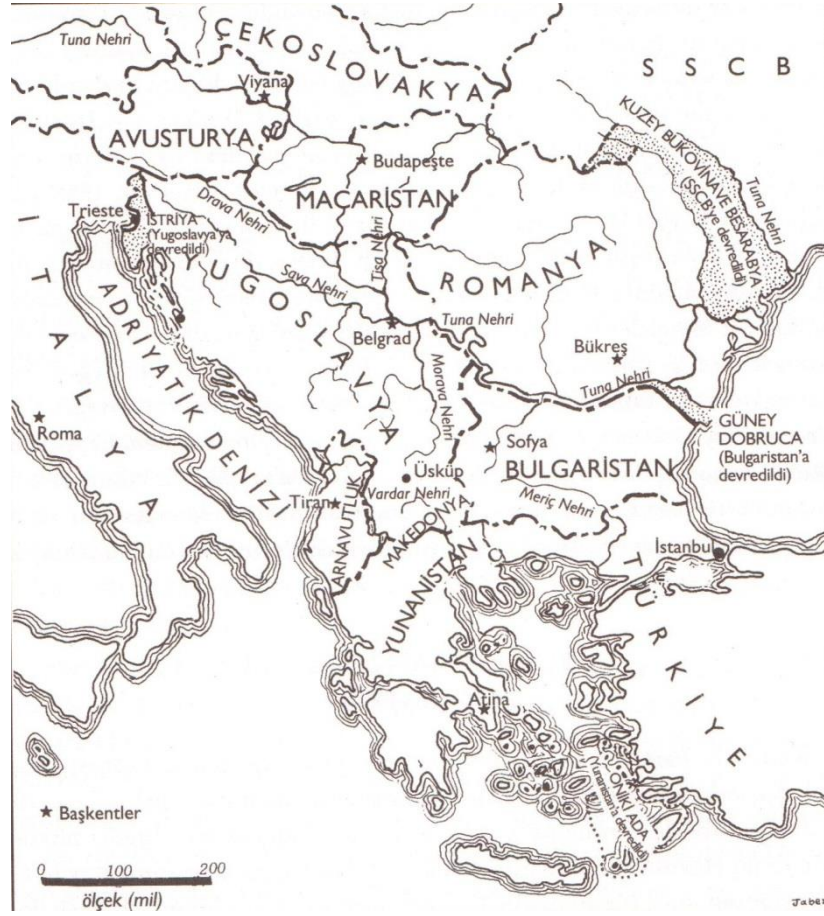
Şekil:2.7. II. Dünya Savaşı'nda Balkanlar