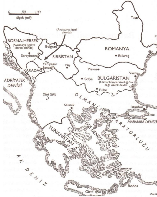
Şekil: 2.3. 1900’de Balkan Yarımadası