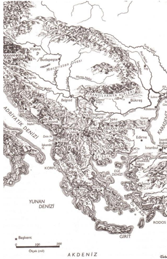
Şekil: 2.1. Balkanların Fiziki Haritası