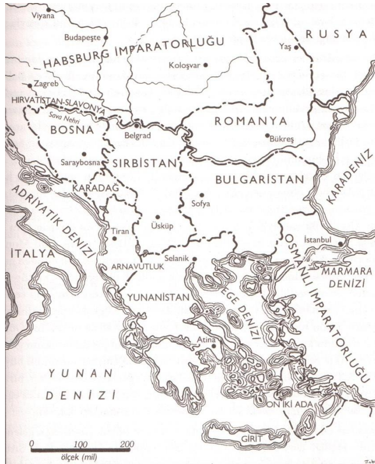
Şekil: 2.4. Balkan Devletleri, 1914.