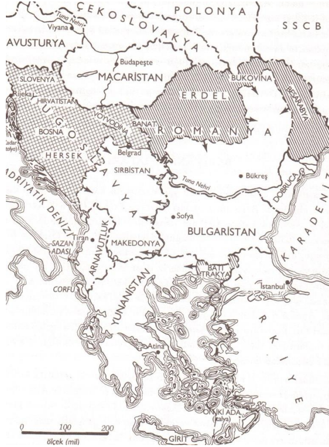
Şekil: 2.5. I. Dünya Savaşı Sonrası Balkan Devletleri