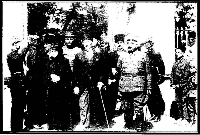
Mustafa Kemal Paşa ile Latife Hanım Orhangazi Türbesi'nden çıkarılarken

Bu gezi esnasında Bursalılar, Atatürk'e sevgilerinin göstergesi olarak Çekirge yolu üzerinde XIX. yüzyıl yapısı olan Albay Mehmet Bey'e ait köşkü satın alarak armağan etmeye karar vermişler ve onu dört gün boyunca burada ağırlamışlardır 14 .