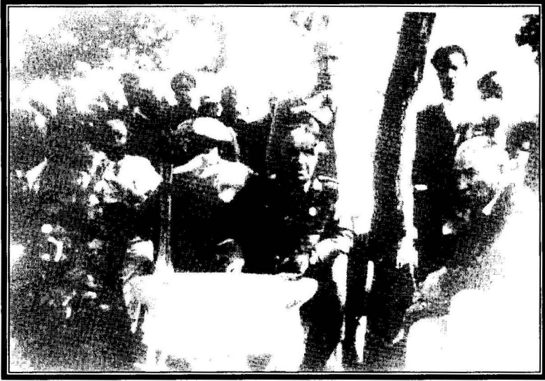
Mustafa Kemal Paşa ve Fevzi Paşa Tophane Parki'nda (23 Mayıs 1926)