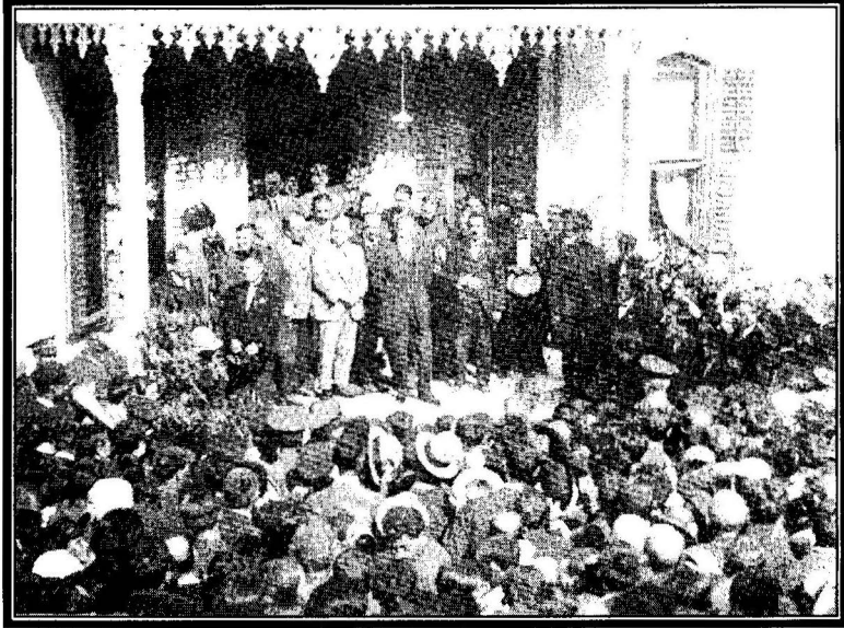
Mustafa Kemal Paşa, Cumhuriyet Köşkü'nün bahçesinde (28 Eylül 1925)

latmak, milletle bütünleşmeyi devam ettirip, pekiştirmek ve yeni inkılâp hareketleri hakkında halkın tepkilerini almak için bir geziye daha çıkan Atatürk, 22 Eylül'de deniz yoluyla Mudanya'ya gelmiş, oradan da Bursa'ya geçmiştir. 8 Ekim'e kadar Bursa'da kalan Gazi, bu süre içinde bir defâ günübirlik Gemlik'e gitmiştir. Gezisi boyunca başta Bursa Türk Ocağı temsilcileri olmak üzere çeşitli heyetler ile görüşmüş, Mısır eski Hidivi Abbas Hilmi Paşa'yı kabul etmiş ve 1 Ekim 1925'te Bursa dokuma fabrikasının temel atma törenlerine katılmıştır 17 .