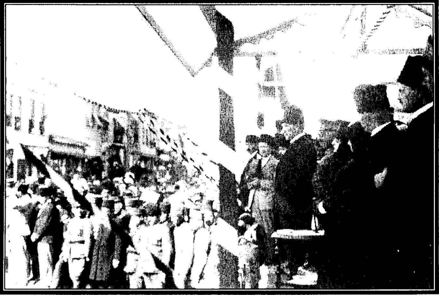
Mustafa Kemal Paşa, 3.Bursa Gezisinde konuşma yapmak üzere (11 Eylül 1924)

Atatürk'ün Bursa'ya ikinci gezisi, Ocak 1923'te çıktığı Batı Anadolu gezisi kapsamında gerçekleşmiştir. Lozan görüşmelerini devam ettiği bir sırada Ankara'da Meclis'te aleyhinde tertiplenen komplolardan bunalan Atatürk, yurt gezisine çıkmaya karar vermiş ve 14 Ocak 1923'te Ankara'dan ayrılmıştır. Bu geziye çıkmaktaki maksadı saltanat ve hilafete dair alınan kararların halk arasındaki tepkilerini incelemek, kurmayı tasarladığı Halk Fırkası hakkında halktan gelebilecek tepkileri ölçmektir 12 . Bu gezide O, 20-24 Ocak 1923 tarihleri arasında Bursa'ya uğramıştır. Bilecik üzerinden Bursa'ya gelen Atatürk, önce İnegöl'de daha sonra da Bursa'da yoğun bir kar yağışına rağmen halkın büyük ilgisiyle karşılanmış, ardından belediye binasına geçerek Bursalıların ve çeşitli meslek gruplarının temsilcilerini kabul etmiştir. 21 Ocak'ta öğretmenlerin verdiği çaya katılmış, ertesi gün de halka açık bir toplantı yapmış ve bazı kimselerin yabancı sermaye, tarım, patrikhane meselesi, azınlıklar, hilafet ve heykel sanatı ile ilgili sorularını cevaplandırmıştır. 24 Ocak'ta Bursa'dan ayrılarak İzmir'e doğru hareket etmiştir 13 .