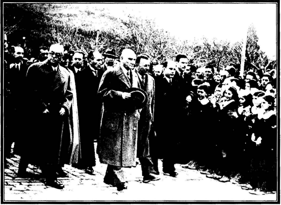
Atatürk, Mudanya'da öğrencileri selamlıyor (3 Şubat 1938)

Atatürk'ün Bursa'ya on ikinci ve on üçüncü gezileri 1933 yılının ilk aylarında gerçekleşmiştir. Cumhuriyetin onuncu yaşına yaklaşıldığı bir sırada Mustafa Kemal Atatürk, yeni bir yurt gezisine çıkmış ve Eskişehir üzerinden 17 Ocak 1933'te Bursa'ya ulaşmıştır. Ertesi gün vilayet, belediye parkı ve komutanlığa uğradıktan sonra Gemlik zeytin üreticileri ile görüşen Atatürk, ardından Çekirge'deki kaplıca inşaatını, İpek-iş fabrikasını ve Askeri hastaneyi gezmiş ve 19 Ocak'ta şehirden ayrılmıştır 25 . Atatürk'ün yurt gezisine devam ettiği ve nihayet İzmir'de gezisini sürdürdüğü sırada, Bursa'da ezanın Türkçe okunmasıyla ilgili olarak bir olay patlak vermiştir. 1 Şubat 1933'de Ulu Cami'de ezanın Türkçe okunmasını protesto eden bir grup, hükümet konağına yürümüş, ezanın tekrar Arapça okunmasını talep etmiştir. Olay yatıştırıldıktan sonra protestocuların on bir kişi tutuklanmışsa da, ertesi gün savcı tarafından serbest bırakılmışlardır. Bu olayın İzmir'de duyulması üzerine Gazi, derhal Bursa'ya gitme kararı almış ve 5 Şubat'ta şehre varmıştır. Hemen olaya el koymuş, savcı ve müftüyü olaya karşı göstermiş oldukları ciddiyetsiz tavır yüzünden görevden uzaklaş-