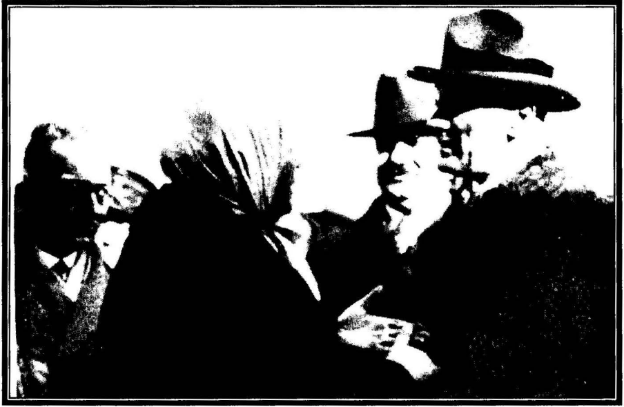
Atatürk, Bursa'da yaşlı bir kadının yakınmalarını dinliyor (4 Ocak 1931)

On altıncı gezisi esnasında (15-17 Temmuz 1935) önce İznik'e uğrayan Atatürk, belediyenin önünde çay bahçesinde oturduğu sırada şehirliler ile İznik tarihi hakkında sohbet etmiş, ardından geldiği Bursa'da çevrede kısa bir gezintiden sonra eski kaplıcada halkla birlikte banyo yapmıştır 50 .