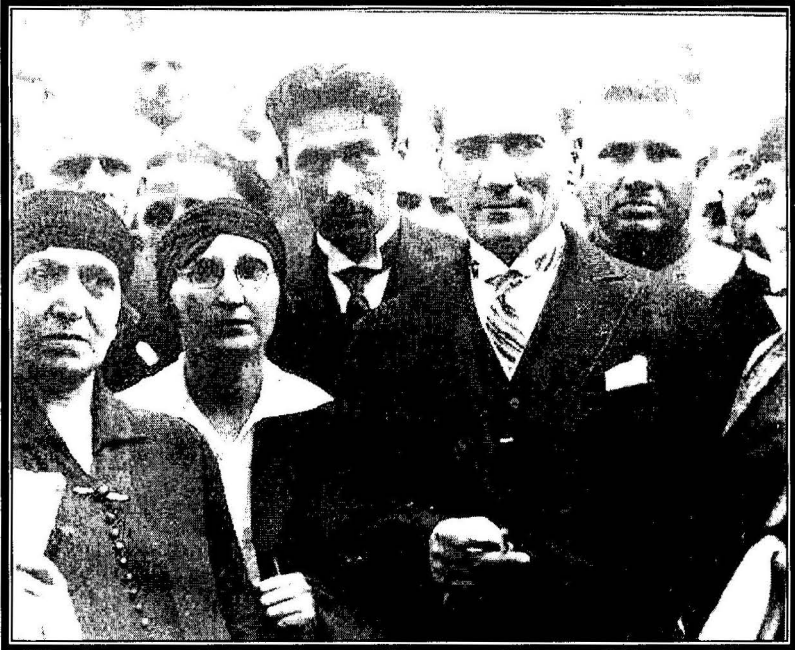
Guzi Paşa, Bursa'da Sanatçılar ile Birlikte (29 Mayıs 1926)