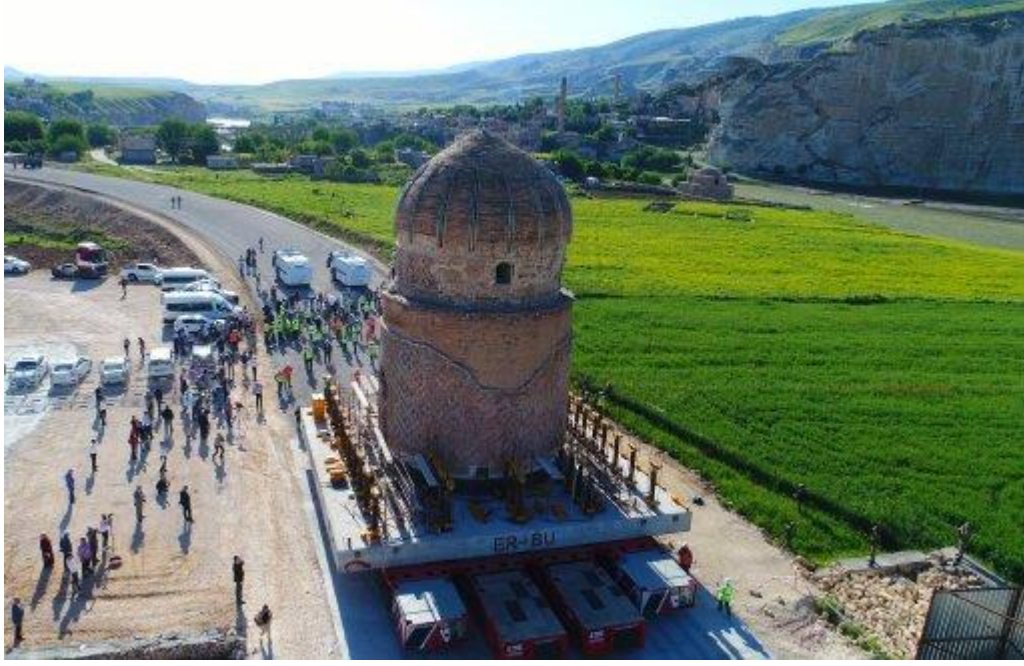
Şekil 2 Zeynel Bey Türbesi Taşınması