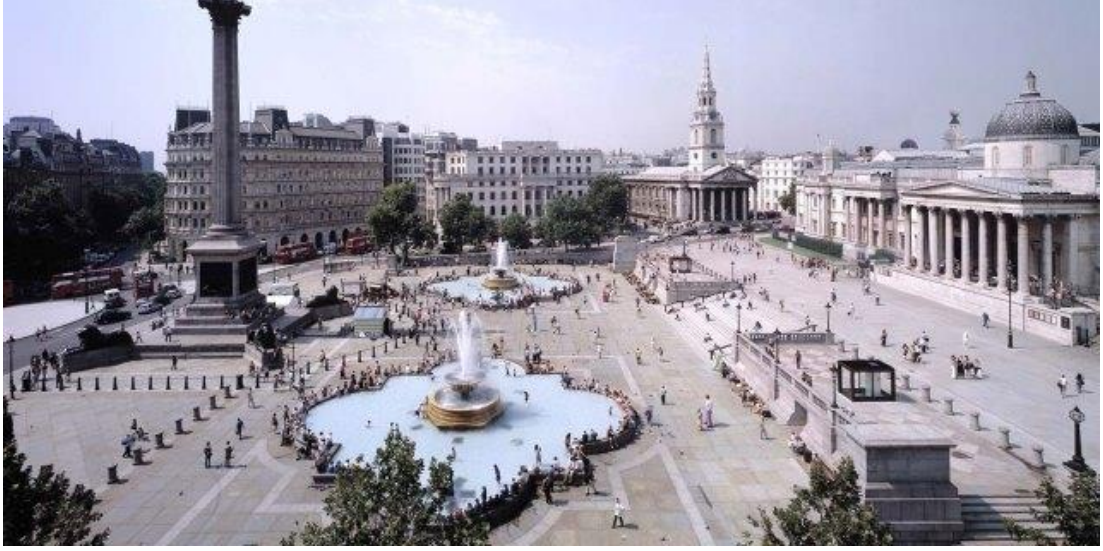
Şekil 4 Dönüşüm sonrası Trafalgar Meydanı

kentsel dönüşüm projesi hazırlanmıştır. Projenin diğer hedefleri arasında meydanın ana kamusal alan olarak düzenlenmek, bina, heykel ve boş alanlarla mekânsal organizasyonunun kurulması ile mekânı eğlenceli ve kullanabilir kılmak ve tarihi çevrelerin kalıcı çağdaş kentsel aktivitelerle donatmak da mevcuttur.