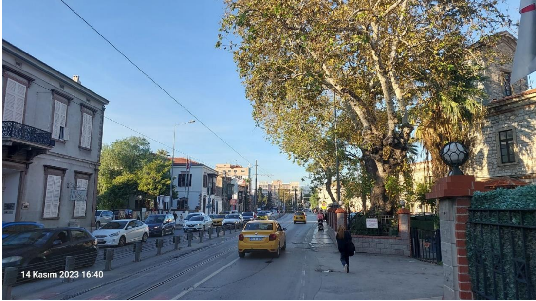
Şekil 3 Alsancak mh Tarihi ve Kültür Varlıkların Kullanım Fonksiyonları