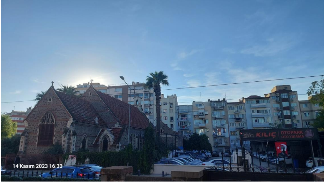
Şekil 6 St John Katolik Kilisesi ve Kent Merkezi Yapıları