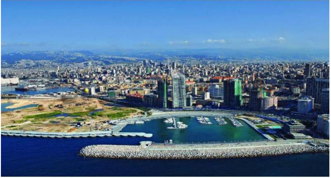
Şekil 5 Solidere Yenileme Projei (web:genderi)

Solidere yenileme projesiyle tarihi kent merkezi ve liman bölgesi birbirine entegre edilmiş ve bu yeni bölgede güçlü bir finans özelliği oluşturulmuştur. Hem bu özelliği ile hem de örgütlenme yöntemiyle kullanılan sistem, proje kendi kendini finanse ederek kamuya herhangi bir ek yük getirmemiştir. Proje, hem bu özelliği, hem de kaybedilen kimlik değerlerinin yeniden kazanılmasının zorluğunu göstermesi açısından dünya çapında önemli bir projeyi kamu-özel yatırımlarıyla gerçekleştirmişleridir.