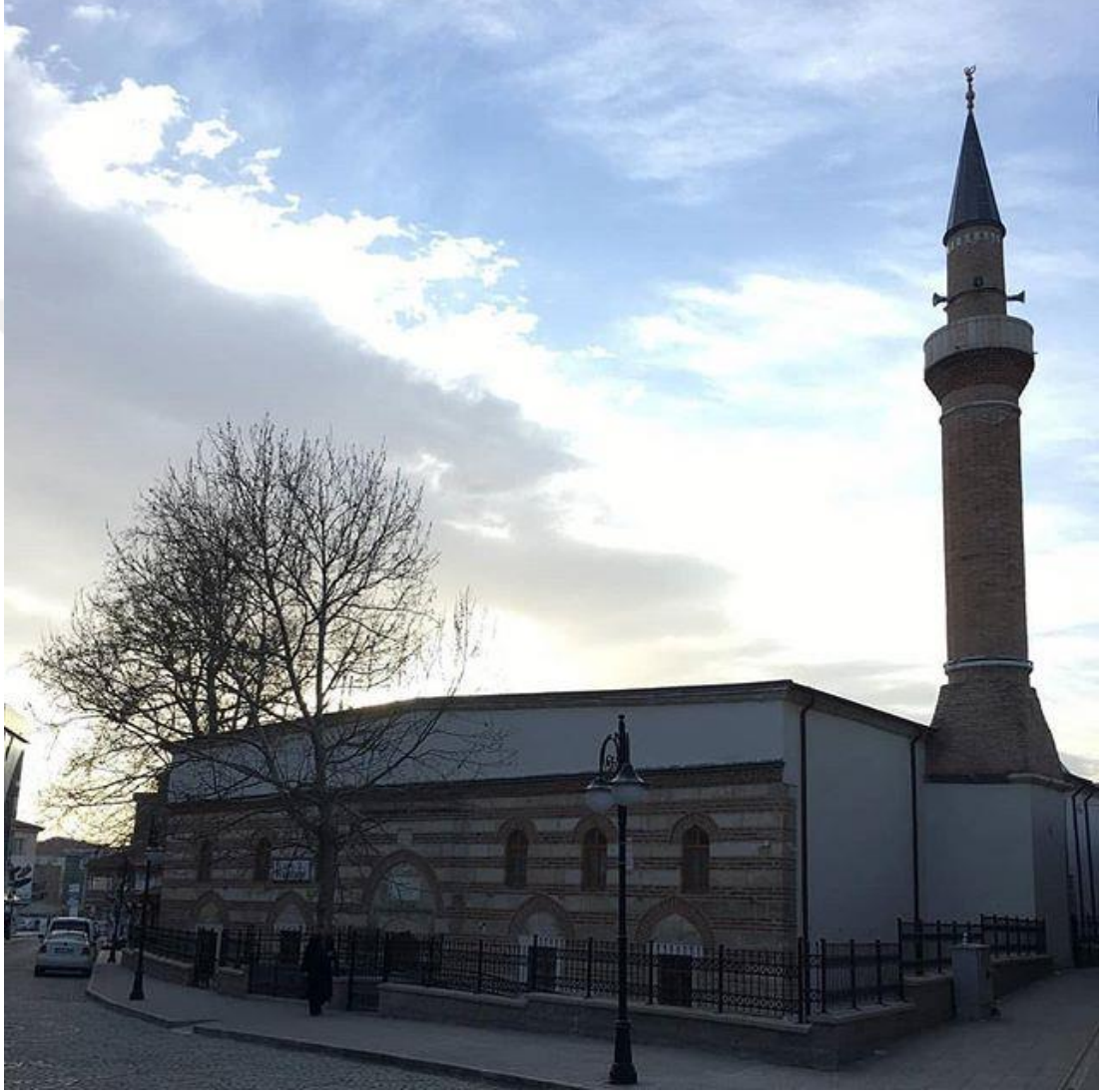
Şekil 3.8: İplikçi Camii [93].

yanında Ulu Camii, Taş Medrese gibi tarihi yapılar da bulunmaktadır. Özellikle Taş Medrese İmarat, Hankah, Türbe ve Mescit gibi yapılardan oluşturularak kullanıma açılmış olup, günümüzde yalnızca türbe ve mescit kısımları kullanılabilir durumdadır. İplikçi Camii Şekil 3.8’de yer almaktadır.