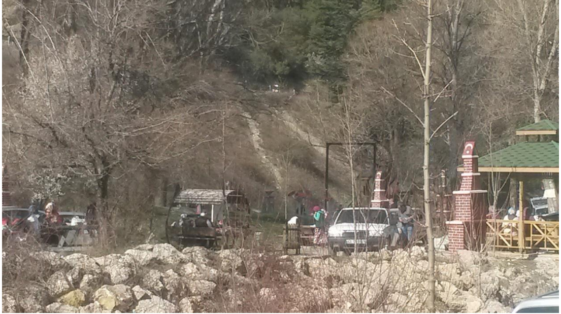
Şekil 3.4 Akşehir Kent Ormanı [93].

Bu tarihsel önemin yanında Akşehir, bir yerleşim yeri olarak sürekliliği olan bir yerleşim alanı ile vakıf eserlerinin en yoğun olduğu yerleşim birimlerinden bir tanesidir. Aynı zamanda ilçede 150’den fazla tescil edilmiş tarihi eser bulunmakta olup, Akşehir; İç Anadolu Bölgesinin korunabilmiş sokak dokuları örneğine sahiptir. Bu kadar tarihi dokuya sahip olmasına rağmen, Akşehir potansiyel açısından bu güne kadar yeterince değerlendirilememiştir. Özellikle de Akşehir’in Kurtuluş Savaşı sırasında batı cephesinin karargahı olması Akşehir’in önemini daha da arttırmaktadır. Bunun yanında bu şehrin, Nasrettin Hoca gibi dünyaca bilinen birinin adıyla birlikte anılması ve Nasrettin Hoca’nın türbesinin burada bulunması şehrin geleceği açısından önem taşımaktadır. Ayrıca ilçenin turizm olanakları ve doğal güzellikleri göz önüne alındığında turizm potansiyeli açısından değerlendirilmesi gereken önemli bir yerdir [52]. Şekil 3.4’de Akşehir Kent Ormanı