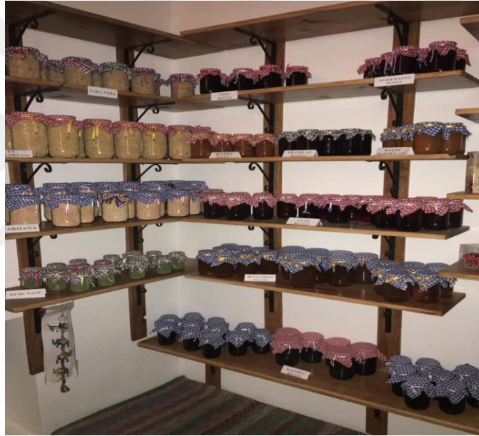
Şekil 3.9 Akşehir'de satılan doğal ürünler [93].

kaybetmesidir. Avrupa ülkeleri ile kıyaslandığında ise ülkemizin sürekli olarak gelişme içerisinde olması, kırsal ve kültürel değerlerini halen koruyor olması yayla turizmi açısından önemli bir potansiyel oluşturmaktadır. Bu potansiyelin önemli coğrafi yerlerinden bir tanesi de Akşehir ve çevresidir. Akşehir'in; Değirmenköy, Çimendere, Engilli, Çakıllar, Atakent, Çamlı, Cankurtaran, Saray, Ilıcak, Tekke, Kuruçay, Yaylabelen, Ulupınar ve Tekke gibi bölgelerinde yaylacılık kültürü halen varlığını devam ettirmektedir [57]. Ayrıca bu bölgelerde hayvancılık da önemli yer tutmakta olup, buralarda yetişen hayvanlar doğal yollardan beslenmekte, böylece organik ürünler elde edilmektedir. Akşehir'de satılan doğal ürünler Şekil 3.9'da yer almaktadır.