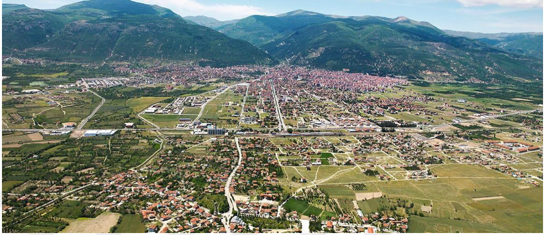
Şekil 3.1: Akşehir'in genel görünümü [72].

sebebiyle ormanlık alanlarda azalma yaşanmaktadır. Yapılan erozyon çalışmaları ile alan, yeniden ağaçlandırılmaya çalışılmaktadır [56]. Akşehir'in genel görünümü Şekil 3.1'de yer almaktadır.