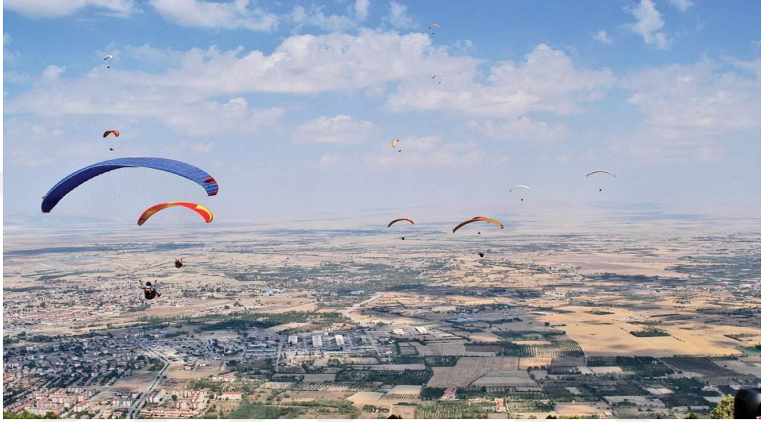
Şekil 3.12: Akşehir'de yamaç paraşütü [51].

üniversitelere ve Türk Hava Kurumuna bağlı kulüpler bölgeyi ziyaret etmekte, böylece bölgeyi tanıma fırsatı yakalamaktadır. Özellikle son dönemlerde ekoturizm açısından ulusal ve uluslararası alanda bölge tanıtılmaya çalışılmakta ve değerlendirilmektedir [63]. Akşehir'deki yamaç paraşütü etkinlikleri Şekil 3.12'de yer almaktadır.