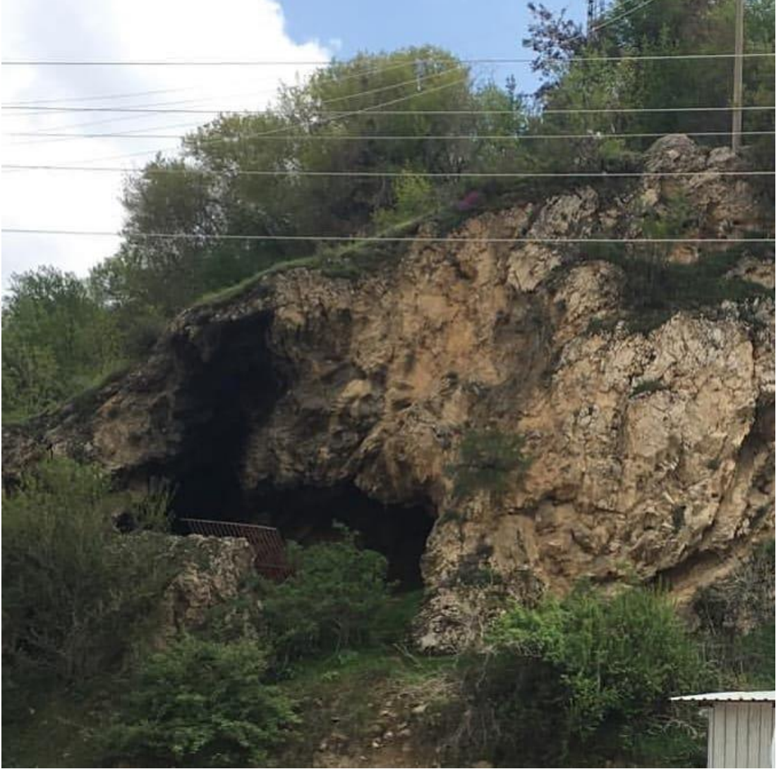
Şekil 3.11: Akşehir Gelincik Tepesi [93].

yürüyüş, gerekse kamp ve tırmanma açısından oldukça uygun bir konuma sahiptir [62]. Şekil 3.11’de Gelincik Tepesi yer almaktadır.