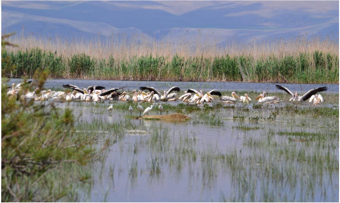
Şekil 3.10: Eber Gölü [79].

güvercin gibi hayvanlar avlanabilmektedir. 12 Ekimden başlayarak diğer yılın 29 Ekimine kadar kınalı keklik, ada tavşanı, ağaç sansarı ve tilki gibi hayvanlar avlanabilmektedir. Bölgede bulunan en önemli sazlık ve göl hayvanları arasında boz ördek, yeşilbaş ördek, kadife ördek, kıl kuyruk, tepeli pakta, fiyu, kaşık gaga gibi hayvanlar bulunmaktadır. Göl hayvanlarının avlanma sezonu 12 Ekimde başlamakta, 16 Şubatta bitmektedir. Akşehir bölgesinde bulunan Eber ve Akşehir gölleri olta balıkçılığı açısından önem taşımaktadır. Bunların yanında çay ve derelerde bulunan sazan ve alabalık türleri sportif olta balıkçılığı açısından oldukça uygundur. Avcılık ve olta balıkçılığı kentin gürültülü ortamından kaçmak isteyen ve doğaya özlem duyan alternatif bir eğlence yöntemidir [62]. Şekil 3.10'da Eber Gölü yer almaktadır.