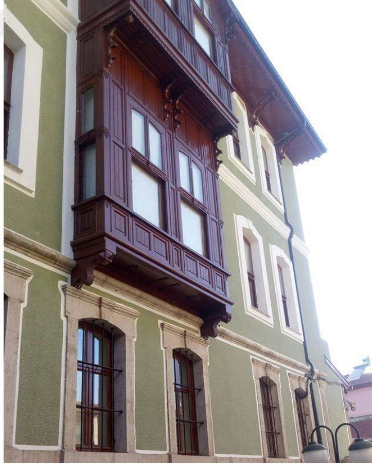
Şekil 3.3: Akşehir'in tarihi değerleri [93].

Akşehir tarihsel süreç boyunca kültür, ticaret ve önemli bir yerleşim birimi olma özelliğini taşımış nadir yerlerden birisi olup, ilçe merkezinin tarihi Neolitik dönemlere dayanmaktadır. İlçede yapılan kazılarda Eski tunç, Kalkolitik çağı, Frig ve Hititlere ait kalıntı ve eserler bulunmaktadır. Ayrıca Kral Yolu olarak da bilinen ve Sardes ile Ninova'ya kadar varan ticaret yolları bu güzergahtan geçmiştir. Tüm bunlar Akşehir'in geçmişte de önemli bir yerleşim yeri olduğuna işaret eden bulgulardır. Bunun yanında Akşehir Roma ve Bizans dönemleri ile Selçuklular Dönemi ve Osmanlı İmparatorluğu döneminde kentsel ve kültürel olarak çok önemli gelişmeler olmuştur [58]. Akşehir'in tarihi değerleri Şekil 3.3'de yer almaktadır.