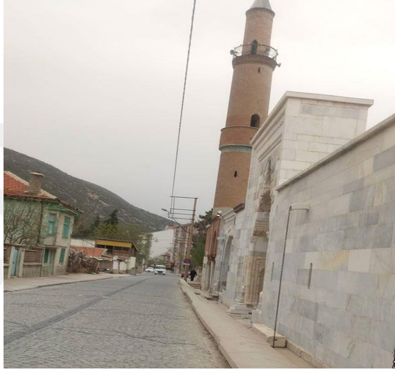
Şekil 3.13: Akşehir Hasan Paşa Camii [93].

yanında bölgede Hasan Paşa İmaret Camii, İplikçi Camii, Nimetullah Nahçivani ve Seyit Mahmut Hayrani gibi türbelerin bu bölgede bulunması ile Nasrettin Hoca Türbesi yılda 110 bin ziyaretçiyi kabul etmektedir. Bölgede bir tane de ermeni kilisesi bulunmakta olup, bu kilise şehrin dini açıdan geçmişi hakkında da bilgi vermektedir [56]. Akşehir Hasan Paşa Camii Şekil 3.13’de yer almaktadır.