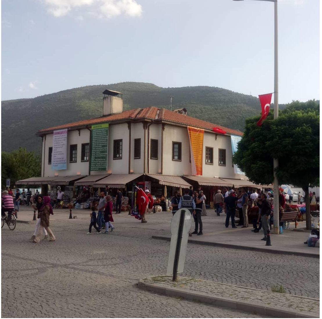
Şekil 3.2: Akşehir’de yaşam [93].

Akşehir ilçesi kırsal ve kentsel nüfus hareketleri açısından incelendiğinde de geçmişten günümüze ilçede farklılıklar yaşandığı gözlemlenmektedir. Akşehir’in tarihsel geçmişine bakıldığında ise önemli oranda nüfus yoğunluğunun olduğu görülmekle birlikte, bu yoğunluğun yaşanmasında bölgede yaşayan Yörüklerin 19’ncü yüzyılda göçebe hayatından yerleşik hayata geçmesinin etkili olduğu görülmüştür. Kır ve kent nüfusu açısından karşılaştırıldığında 1927 yılında yapılan sayımlara göre kır nüfusu daha fazla iken, günümüzde kent nüfusunun kır nüfusunu geçtiği belirlenmiştir. 1927 yılı sayımlarına göre kır nüfusu 36.768 kişi olarak belirlenirken, 2007 yılı verilerine göre kır nüfusu 36.359 olarak belirlenmiştir. Buna karşılık 1927 yılı verilerine göre kent nüfusu 9.293 kişi olarak belirlenirken, ilk defa