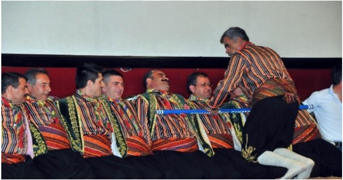
Şekil 3.5: Akşehir sıra yarenleri [75].

Sıra Yarenleri: Yarenlik, Türk kültür geleneğinde farklı isimlerle adlandırılan halk kültürü geleneği arasında yer almaktadır. Gençler başta olmak üzere bu geleneği benimsemiş olanlar birbirlerini genel olarak yaren olarak adlandırmakta ve bu şekilde hitap etmektedirler. Akşehir’de özellikle gençler sırası ile bir yarenin evinde oturarak genellikle saz çalarak eğlenmekte, bu ise Akşehir’de sıra yarenler olarak adlandırılmaktadır. Sıra yarenleri içerisinde bir yönetim kadrosu da oluşmakta, bunlar; çavuş, bölükbaşı, yaren ağası, kahya beyi ve yiğitbaşı olarak adlandırılmakta, rütbe almayanlar ise yaren olarak nitelendirilmektedir. Şekil 3.5 sıra yarenlerini göstermektedir.