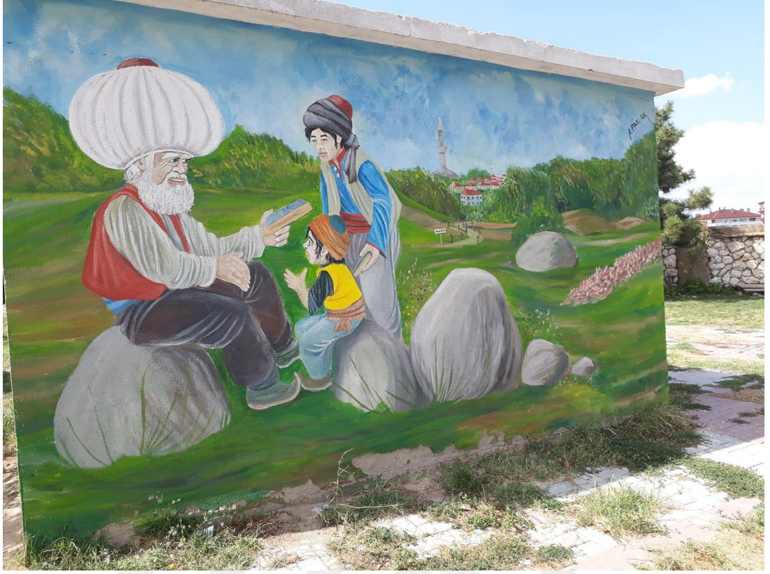
Şekil 3.7: Nasrettin Hoca “Parayı veren düdüğü çalar” Figürü [93].

Akşehir’de ayrıca Batı Cephesi Karargahı Müzesi bulunmaktadır. Bu bina 1921 ve 1922 yıllarında Batı Cephesi Karargahı olarak kullanılmış; Kurtuluş Savaşı yıllarında Büyük Taarruz buradan idare edilmiştir. Batı Cephesi Karargahı olarak kullanılan bu bina 1946 yılından itibaren müze olarak kullanılmaya başlanmıştır. Müze şu anda kendi adını taşıyan meydana bulunmakta olup, kullanım yoğunluğu oldukça yüksek olan bir yerde bulunmaktadır. Bu tarihi yapıların yanında Akşehir’de önemli ve tarihi dokuya sahip çeşitli camiler de bulunmaktadır. İmaret Camii bunlardan bir tanesidir. İmaret Camii Beyazıt döneminde 1510 yılında o dönemde Rumeli Beylerbeyi Hasan Paşa tarafından yapılmıştır. Cami bugüne kadar birkaç kez onarılarak ayakta tutulmaya çalışılmıştır.