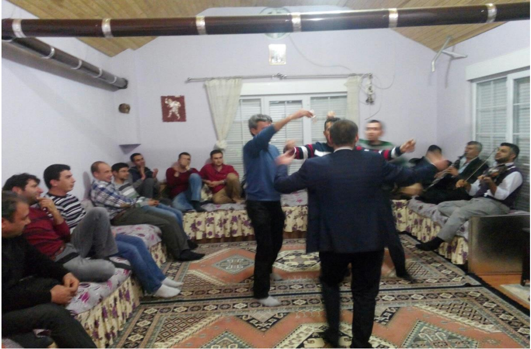
Şekil 3.6: Akşehir'de kına töreni [93].

Nişan ve Kına Törenleri: Akşehir ilçesi nişan ve kına törenleri açısından da bir takım kültürel özelliklere sahiptir. Özellikle nişan törenlerinde kadınlar ve erkekler için bayanlar ve erkekler şerbeti yapılmaktadır. Bayanlar şerbetinde, dünürlüğün arkasından oğlan evinde şerbet yapılarak komşular davet edilirken, yine erkek evinde kadınlar şerbetinin düzenlendiği günün akşamı erkekler için de tören düzenlenmektedir. Ayrıca yörede düğünün yapılmasından iki gün öncesinde eş, dost ve akrabalar eşliğinde kına yakılmaktadır. Kına esnasında Karanfilsin ve Gıcılar gibi türküler söylenerek kına yakılmaktadır. Aynı günün gecesinde ise erkek tarafında kına yakılmaktadır. Kına töreni Şekil 3.6'da yer almaktadır.