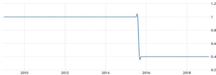
Şekil1.4: Yıllara Göre Gürcistan'da Ham Petrol Üretimi (2010-2018)

Kaynak: Trading Economics (Erişim Tarihi: 23.05.2019)