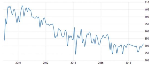
Şekil 1.2: Yıllara Göre Azerbaycan'da Petrol Üretimi (milyon ton)