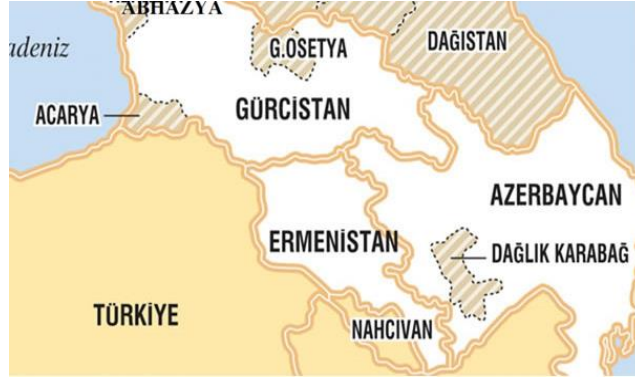
Şekil 1.1: Transkafkasya'nın Coğrafi Konumu

Güney Kafkasya kültürel açıdan çeşitliliğe sahip bir bölge olmasının yanında hem kıtalararası bir köprü hem de yüzlerce yıldan beri Doğu-Batı, Kuzey-Güney Avrasya arasında enerji ve nakliye alanında geçiş bölgesidir. Aynı zamanda Avrupa, Asya ve Afrika kıtalarını birbiriyle buluşturan önemli bir coğrafi konumdadır. Kafkasya ve Güney Kafkasya bölgeleri 19.yy'da İran, Türkiye ve Rusya arasında, 20.yy'da ise Doğu ile Batı arasında tampon bölge olması sayesinde önem kazanmıştır. Bunun yanında bölge sahip olduğu farklı etnik, toplumsal ve dini yapısıyla çeşitli medeniyet ve halklar arasında köprü görevi görmüştür (Karabayram, 2007: 132). Şekil 1.1'deki haritada Güney Kafkasya'nın coğrafi konumu gösterilmektedir.