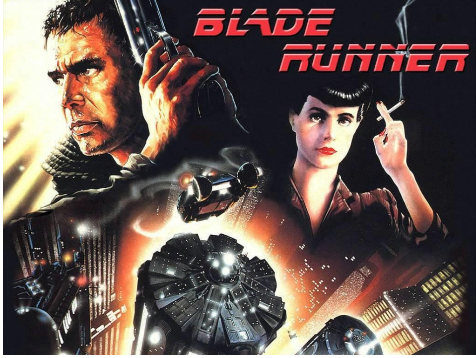
Şekil 1 Blade Runner (1982) filmi

insanların hayal gücüyle birleştğinde ortaya çıkan bilim kurgu eserlerinin temel sorununu oluşturdu.