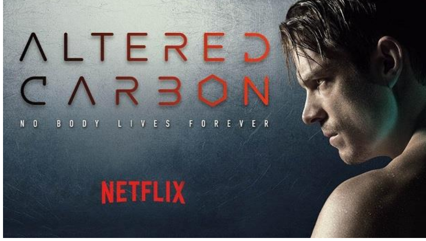
Şekil 4 Altered Carbon (2018) Dizisi Afışı

etmiştir. Ayrıca ana karakterin askeri yapıda olması Transhümanizm'in militar yapıyı güçlendireceği düşüncesi ve adalet sağlayıcıların daha çok asker üretecek olması ön görüşünü desteklemektedir.