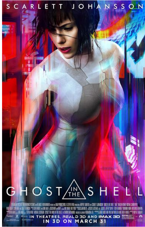
Şekil 5 Ghost in the Shell (2017) filmi afişi

görmektedir. Transhümanizm’in ve teknolojinin askerileşmesi konusu bu yapımda da ortaya çıkmaktadır. Alışılğeldik siberpunk yapımlarındaki ana karakterin erkek ve polis/asker olması bu yapımda biraz farklılık göstermektedir. Ana karakter Mira’nın sentetik bedeni kadın formunda yaratılmış olsa da aslında siborg olduğu için cinsiyetsizleşme durumu vardır. Siborg Manifestosu’nda yer aldığı gibi siborglaşmanın cinsiyet eşitliğini getireceği düşüncesi burada daha fazla ön plana çıkmıştır. Bu nedenle bedenden arınma ve cinsiyetsizleşme temasının daha belirgin şekilde işlendiği görülmektedir. Beden burada “kabuk” olarak değerlendirilmektedir. Çalışmanın diğer örnekleme olan ve yukarıda analizi bulunan Altered Carbon (2018)’da olduğu gibi kabuk ya da kılıf tanımlaması bu yapımda da yer almaktadır.