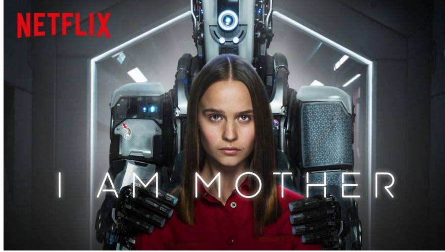
Şekil 2 I Am Mother (2019) film afişi