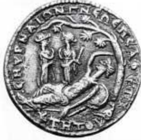
Şekil 4. İskender'in Rüyasını Anlatan İzmir Parası

Kaynak: Ekrem Akurgal, Eski Çağda Ege ve İzmir, Yaşar Eğitim ve Kültür Vakfı, 1993.