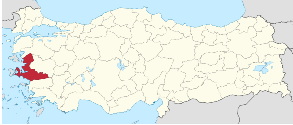
Şekil 1.İzmir'in Türkiye'de Konumu

Türkiye'nin batısında ve Ege kıyısında yer alan İzmir; coğrafi konum olarak 37 45' ve 39 15' kuzey enlemleri ile 26 15' ve 28 20' doğu boylamları arasında bulunmaktadır. Türkiye'nin üçüncü büyük şehri olan İzmir'in kuzey kesiminde Balıkesir, doğu tarafında Manisa, güney kesiminde Aydın ve batı tarafında Ege Denizi bulunur. 200 km kuzey-güney uzunluğuna ve 180 km. doğu-batı genişliğine sahip İzmir, 9 4.462.056 nüfusu ile 2022 yılı rakamlarına göre Türkiye'nin en kalabalık üçüncü ilidir. 10